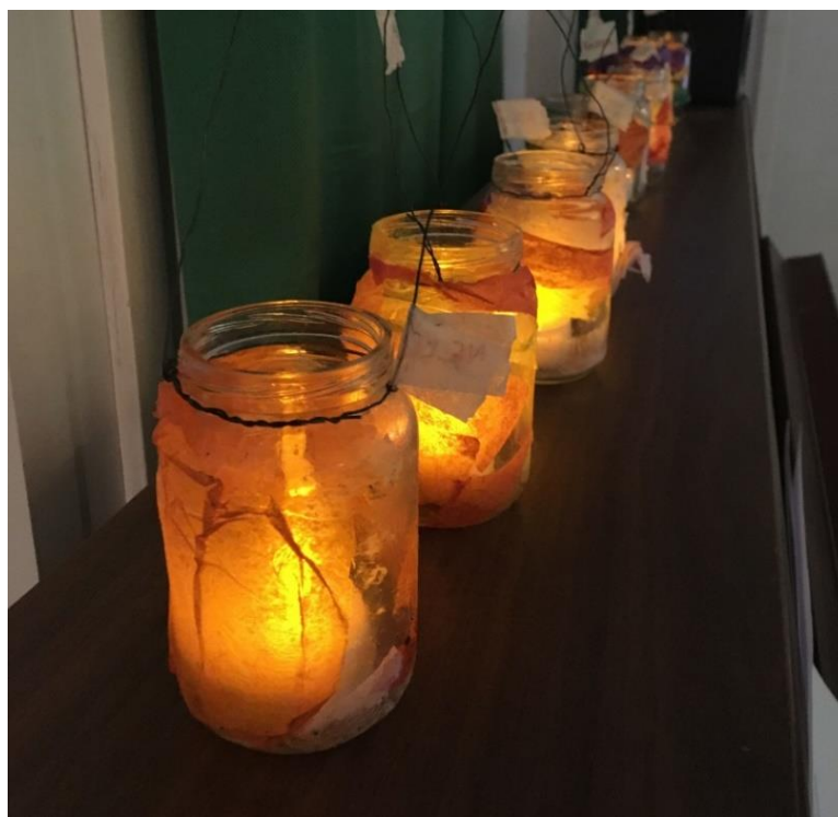
Kuva 3. Itsenäisyyspäivänjuhlan lyhdyt päiväkotia Hertassa.

Jos aikaa olisi ollut enemmän, olisi 4–5-vuotiaiden ryhmälle voinut suunnitella haastavammankin musiikkiesityksen. Ryhmän lapset olivat todella musikaalisia, ja he olisivat pystyneet toteuttamaan haastavampiakin musiikillisia toimintoja. Ryhmä olisi esimerkiksi voinut jakaa kahtia, ja lapset olisivat voineet soittaa eri soittimin yksinkertaisia erilaisia rytmejä. Olen kuitenkin tyytyväinen esitykseemme, sillä se onnistui suunnitelmieni mukaisesti, ja myös lapset näyttivät nauttivan siitä.