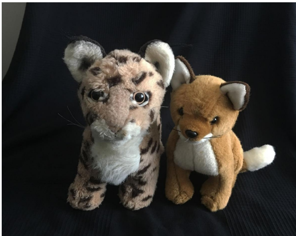
Kuva 1. Tunneilla käyttämäni kettu- ja ilvespehmolelut.

Loppurauhoittumisen aikana lapset saivat makoilla lattialla pitkällään tai mennä aiemmin mietittyihin ”pesäkoloihin”. Taustamusiikin soidessa kiersin jokaisen lapsen huivilla (ketun hännällä) silittäen. Rauhoittumishetken jälkeen kokoontuimme vielä yhteiseen piiriin, jossa jokainen lapsista sai vuorotellen kertoa musiikin aikana mieleen tulleista asioista. Tunnin loppuun lauloimme Soittorasian . Loppulaulun jälkeen muodostimme muskarijunan ja lähdimme Pienen pienen veturin tahtiin yhteisessä jonossa muskaritilasta.