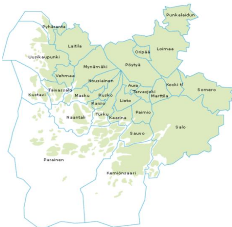
Figur 3: Karta över skärgårdskommunerna Pargas stad och Kimitoön som hör till Åbolands skärgård (I samma båt - samassa veneessä r.f. ry., 2014, 35)