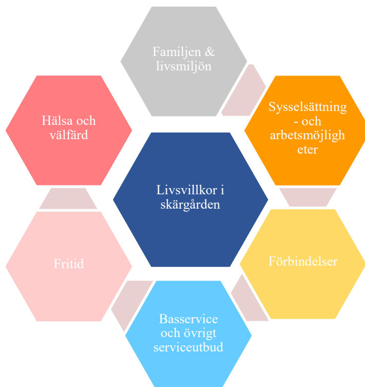
Figur 1: Modell som utvecklats för detta arbete med delar som är inkluderade i skärgårdsfamiljens livsvillkor.