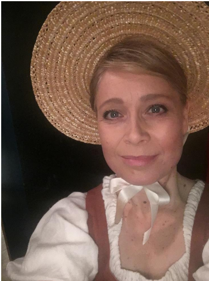
KUVA 1. Puutarhuri