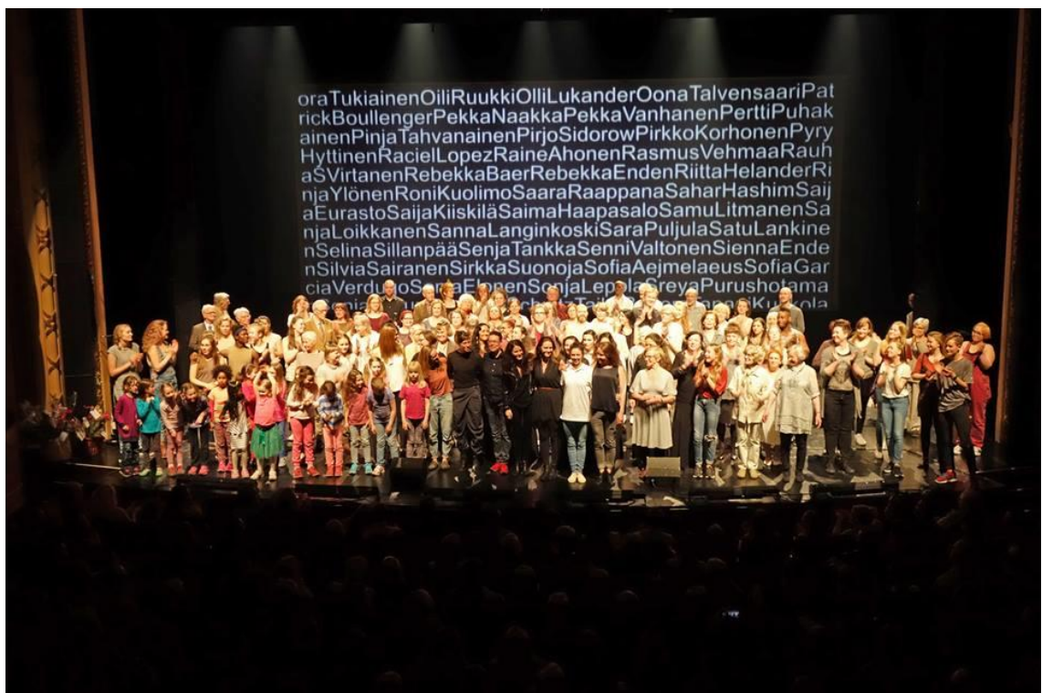
Karavaani 2017: Esiintyjät.