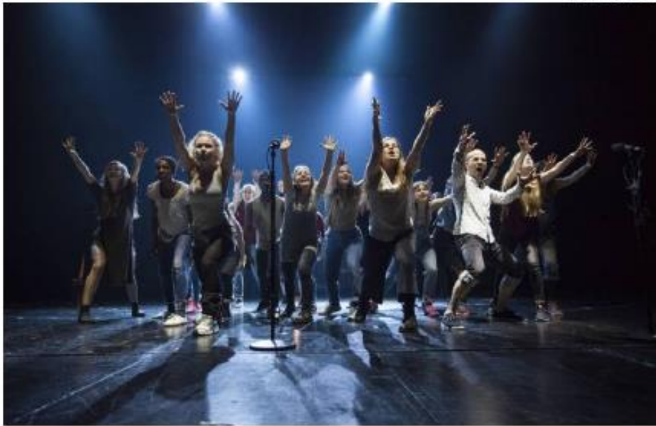
Energiaa ja haastetta rampin yli: Karavaanisea kaikkia innoitettiin mukaan.