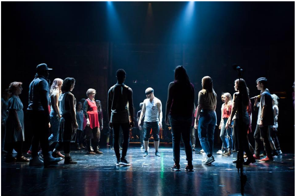
Karavaani 2017: Sokkoleikki.