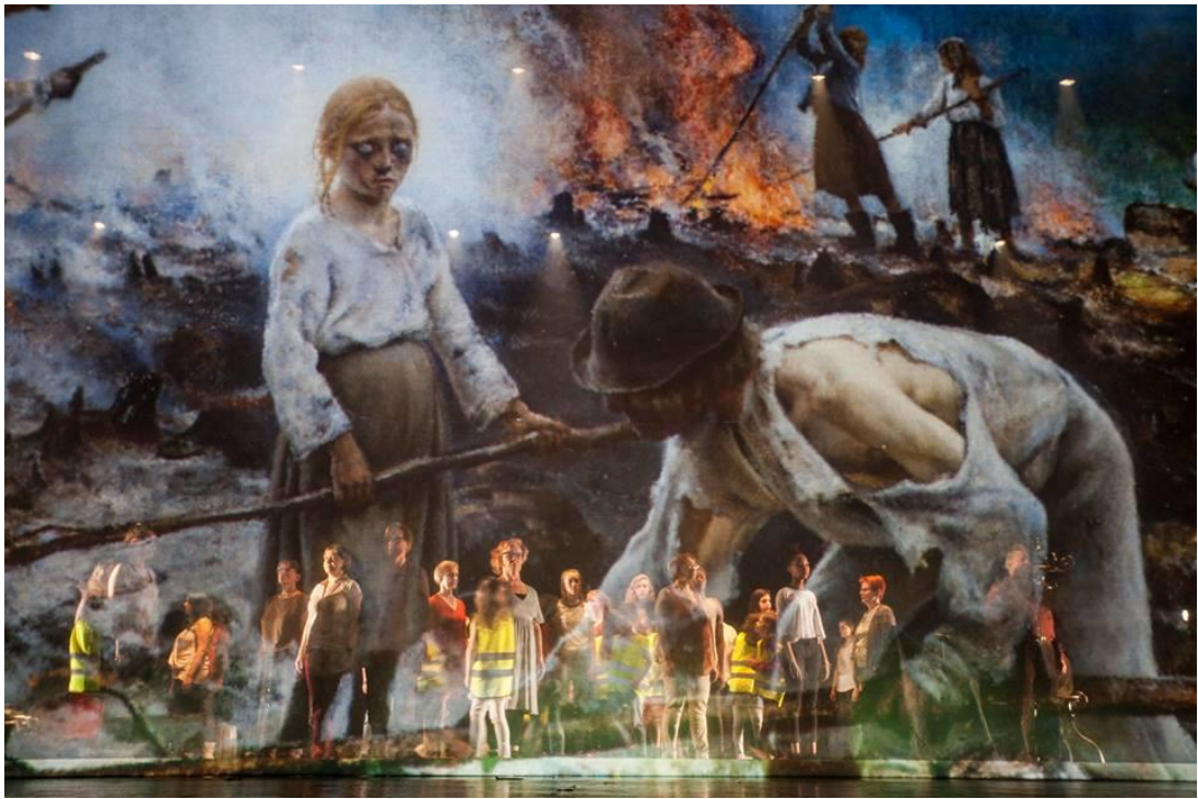
Karavaani 2017: Raatajat.

5. ONNENPYÖRÄ. Onnenpyörä- kohtauksessa koko suuren näyttämön tila aukesi kun- nolla ensimmäisen kerran esityksen aikana. Kansallisteatterin Suuren näyttämön lavassa on suuri ympyrän muotoinen osio, jonka saa pyörimään. Siihen oli laitettu tasavälein eri- laisia, esityksessä käytettäviä esineitä. Se kuvasti elämän onnenpyörää. Osa esiintyjistä tuli seisomaan tasavälein pyörän ympärille odottaen, mitä onnenpyörä heille tuo. Pyöri- vän lavan keskellä oli osa muusikoista soittamassa. Pyörän alkaessa pyöriä he alkoivat soittaa Onnenpyörä - kappaletta. Lavalla olevassa onnenpyörässä oli esimerkiksi rulla- lauta, jonka Bruno lopulta sai ja kuntopyörä, jolla Inari myöhemmin esityksessä pyöräi- lisi. Samalla kohtaus oli siis joidenkin hahmojen henkilöesittely. Kun pyörä pysähtyi, jo- kainen henkilöistä katsoi kohdalleen pysähtynyttä esinettä ja poistui sen kanssa lavalta. Kohtaus kertoi siitä, miten roolit jakautuvat Karavaani-teoksessa ja samalla elämässä yli- päättään. Jokainen meistä on tavallaan onnenpyörässä: vaikka omilla teoillamme toki on vaikutusta, emme kykene täysin hallitsemaan elämämme kulkua, emmekä ole itse voineet valita lähtökohtia elämäämme. Olemme siis ottaneet ja otamme yhä niin sanotusta elämän onnenpyörästä sen, mitä se etemme pyöräyttää. Kohtauksen lopussa muutama esiintyjä myös kulki lavan läpi oman esineensä kanssa. Tässä vaiheessa itse kävelin lavan poikki huiluni kanssa, jota myöhemmin esityksessä tulisin soittamaan.