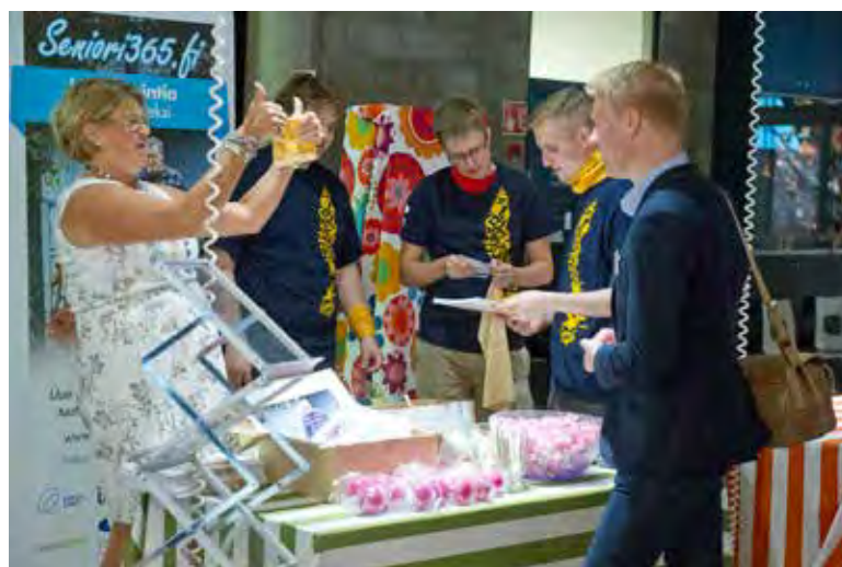
Seniorei365.fi esittelyssä Espoon syystreffeillä 2014

www.seniorei365.fi helpottaa senioreiden arkea ja tukee lisäksi Espoon alueen yrittäjien työllistymistä, uusien hyvinvointialan yritysten perustamista sekä opiskelijoiden kannustamista osuuskuntayrittäjyyteen. Lisäksi se on tarjonnut usean eri alan opiskelijoille harjoittelu- ja oppimismahdollisuuksia. Sivustolla kohtaavat seniorit, heidän omaisensa sekä palveluntarjoajat kuten yritykset, julkiset ja kolmannen sektorin toimijat sekä opiskelijat.