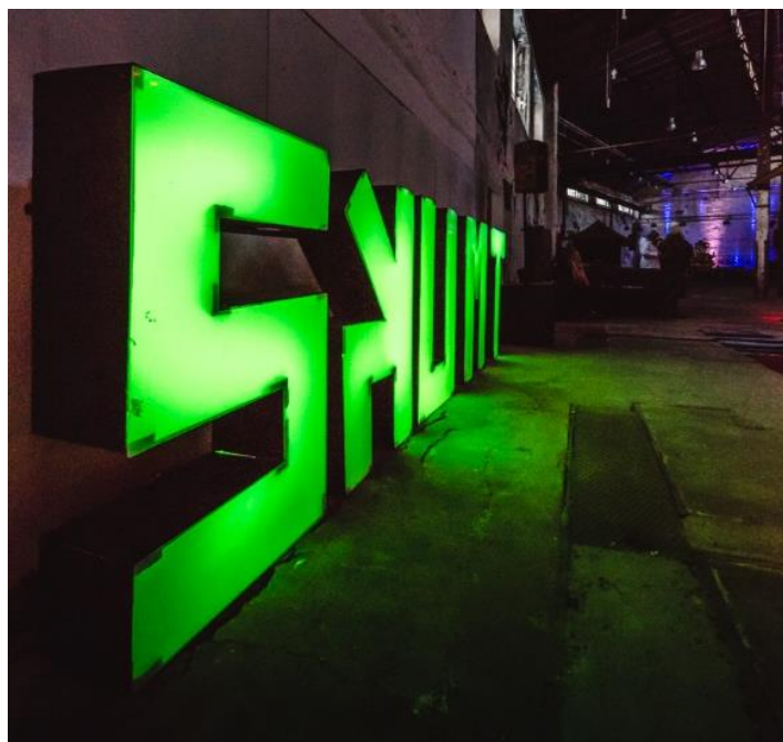
Figur 1 Vår Skumt-skylt som användes på evenemanget 31.3.2018.

Under processen använder jag mig av egna iakttagelser från planeringen, genomförandet samt evaluerandet av evenemanget. För att få en bild på hur väl evenemanget lyckades kommer jag att använda mig av muntlig feedback från publiken samt iakttagandet av all synlighet runt evenemanget.