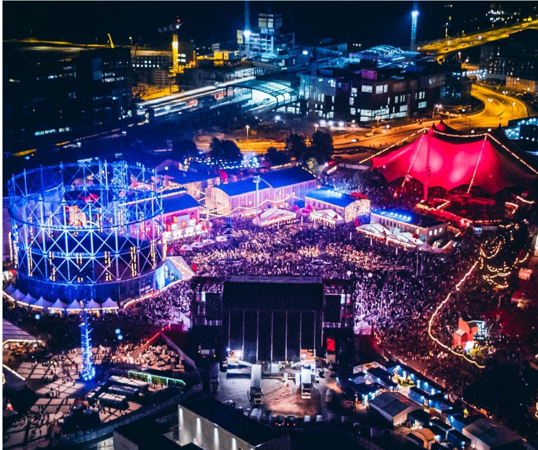
Figur 6. Flow Festival 2017