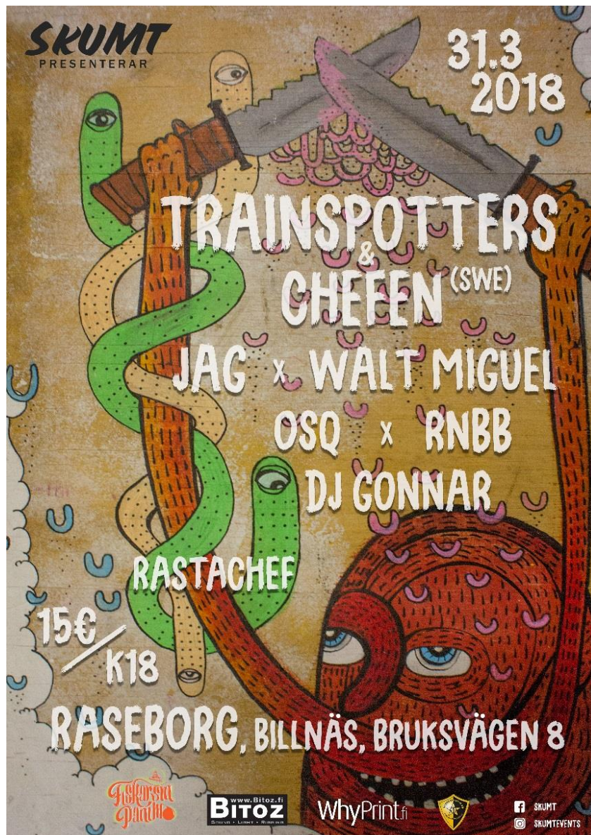
Figur 14. Vår affisch för evenemanget.

Sedan hade vi tidigt utvecklat en plan på hur vi skulle komma fram på sociala medier. Våra huvudkanaler var Facebook och Instagram, där vi gjorde flera editerade videon och tog bilder för marknadsföring. Vissa av våra videon fick över 2000 visningar och hade en bra spridning.