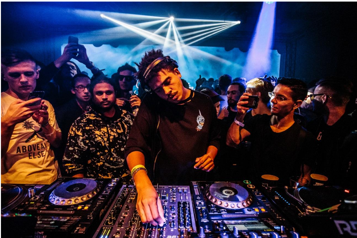
Figur 3. Så här kan en klubbkväll se ut i Boiler room.

Boiler room är en global plattform för artister att uppträda direktsänt för upp till 400'000 åskådare via nätet. Boiler room har ordnat spelningar i över hundra storstäder världen runt och ger en ny fräsch scen för DJ:s och artister världen över. Artisterna kommer också nära sin publik i form av att uppträda från publiken. Ingen scen behövs alltså. Boiler room ger plats åt musikgenren som är lite mera okända, som garage, house, techno, dub och på senare tid grime, hip hop och jazz. https://boilerroom.tv/