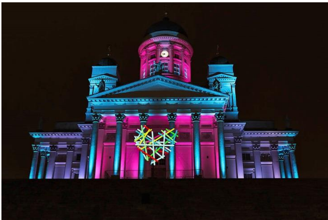
Figur 4. Helsingfors domkyrka som är upplyst av LUX Helsinki

Konepajan Bruno har lyckats skapa ett kulturcenter i ett gammalt tågstation i Helsingfors centrum. Där erbjuds livemusik, mindre företag som gör mat och dryck och på dagarna brukar där ordnas lopptorg. Konepajan Bruno har fångat en unik plats och fyller den med mångkulturell verksamhet som lockar och ger exempel på hur variation kan lyftas fram. http://www.konepajanbruno.fi