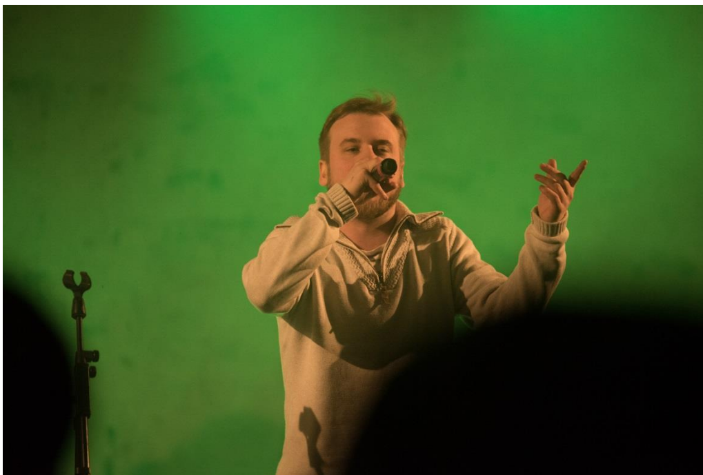
Figur 10. En av förbands Artisterna: OSQ.

annat att bygga ihop alla våra konstruktioner och konstverk på området, ringa runt till sponsorer och hjälpa med förslag och idéer. Vi jobbade i över två hundra timmar per man med planering och skapande av evenemanget. Det är en tidskrävande process och det är lätt att drabbas av stress. Därför är det väldigt viktigt att alla har en positiv attityd och en gemensam vision på projektet som man brinner för.