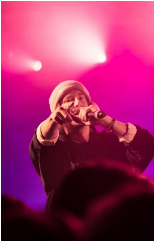
Figur 16. Erk från Trainspotters

Som yrkeshögskolan Arcada använder som sin slogan "Stay curious". Håll dig nyfiken. Det är precis vad vi på Skumt ska fortsätta med, hålla oss nyfikna för nya fantasier och idéer. Och inte vara rädda med att pröva oss fram. För sist och slutligen är det nyfikenheten, modet och drömmen som skapar framtiden.