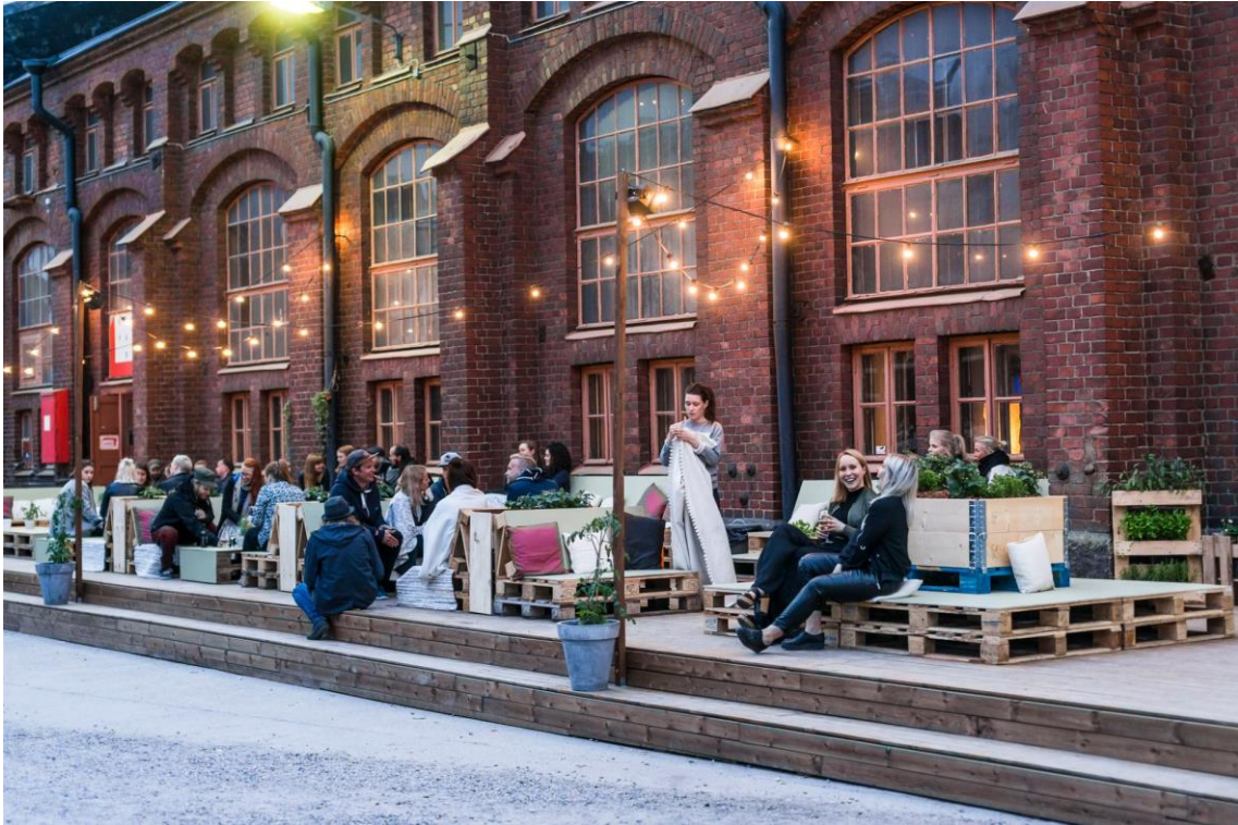
Figur 5. Konepajan Bruno

Slutligen har vi Flow Festival som grundades 2004 och som årligen ordnas i Södervik, Helsingfors. Det är enligt mig Finlands främsta Festival som lyckas visuellt, kreativt och alltid har en intressant och fräsch artistlista. År 2014 utsåg The Guardian, Flow Festival till att vara en av Europas tio bästa festivaler. Att bli omnämnd av den brittiska dagstidningen "The Guardian" är en stor merit som Flow Festivalen kan stoltsera med. https://www.flowfestival.com