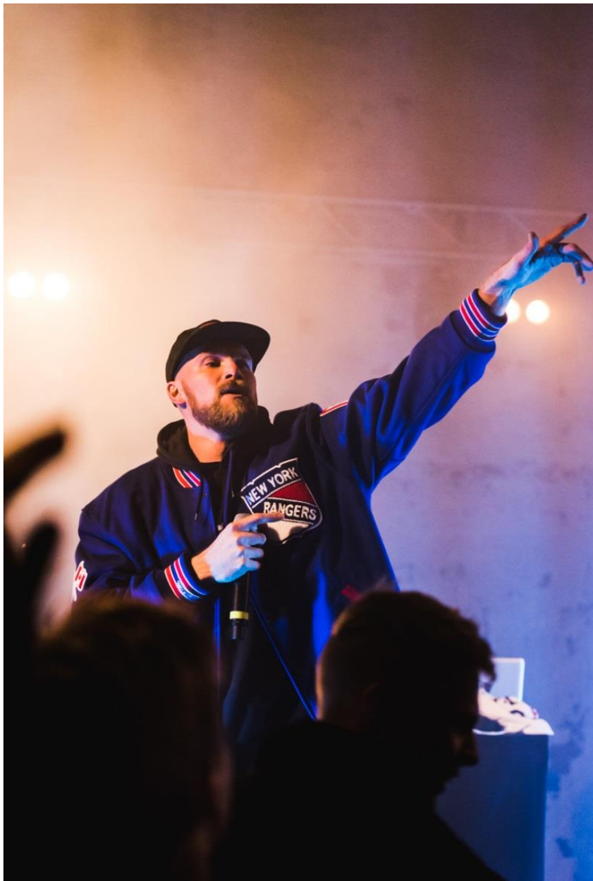
Figur 15. Artisten JAG.

nerationer som besökte evenemanget. Det var en tydlig grupp på unga vuxna som var vår huvudmålgrupp. Men sedan fanns det en stor grupp medelålders besökare som hade hittat till evenemanget. En besökare i femtioårs åldern kommenterar att man inte hade trott att det skulle vara så många jämn åriga här på tillställningen som det var. Så fortsatte besökaren berätta om hur kreativt vi har lyckats med inredningen. "Det är lite som att komma till en drömvärld" påstår besökaren och ser nöjd ut.