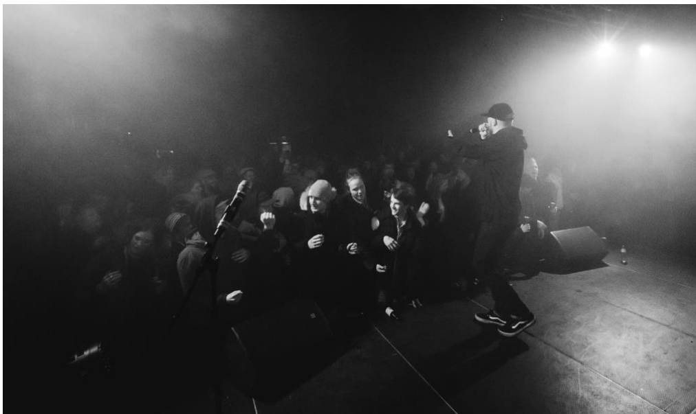
Figur 13. Artisten JAG och publikhavet.