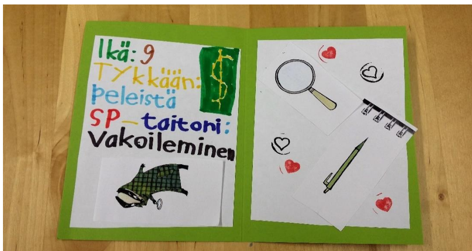
Kuvio 2: Salapoliisipassi

Lasten tuotoksia dokumentoitiin valokuvaamalla niitä lasten ja vanhempien luvalla. Halusin laittaa joitain valokuvia myös raporttiini havainnollistamaan mitä ryhmäpäivissä tehtiin ja jotta muutkin näkisivät lasten upeita tuotoksia!