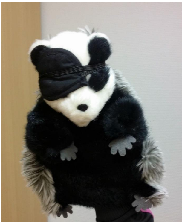
Kuvio 6: Mäyrä merirosvona

”No se jos on paha mieli niin silloin pitää avata laatikko niin tulee parempi mieli. Et aina kun mulla on paha mieli niin mä luen sieltä niin mulle tulee parempi mieli.” Lapsi kommentoi kehulaatikon hyödyllisyyttä ja tarpeellisuutta.