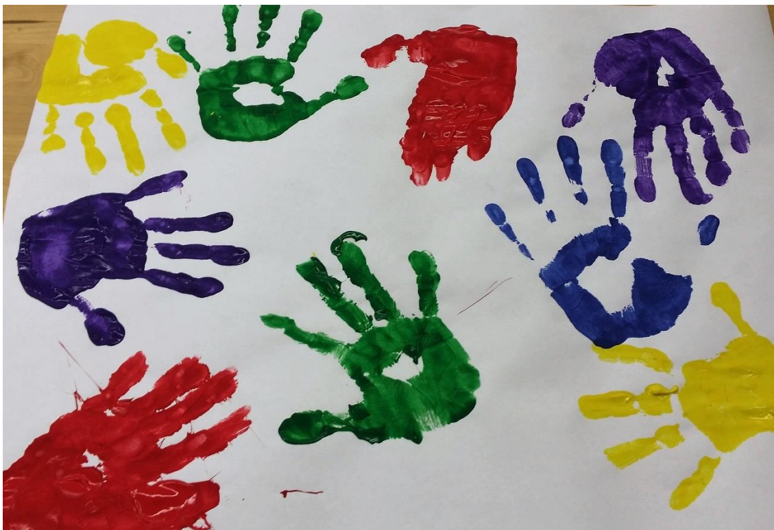
Kuvio 7: Ryhmäkuva

Ryhmäkuvassa on kaikkien kädenjäljet painettu paperille sormiväreillä. (Kuvio 7) Vaikka ryhmäpäiviä oli vain kaksi, ehti ryhmän jäsenten välille syntyä luottamusta ja kiintymystä. Kotiinlähtö toiselta kerralta oli lapsille haikaa ja haleja jaettiin moneen kertaan.