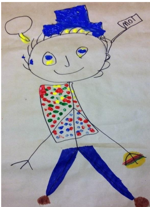
Kuvio 3: Perhetyöntekijä

Lapset piirsivät tai maalasivat hienoja perhetyöntekijöitä. Kuviossa 3 perhetyöntekijä moikkaa ja puhekupla kuvaa perhetyön sisältöä, eli juttelua.