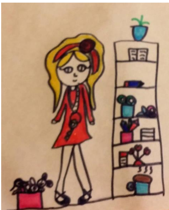
Kuvio 4: Perhetyöntekijä

Lapset piirsivät tai maalasivat hienoja perhetyöntekijöitä. Kuviossa 3 perhetyöntekijä moikkaa ja puhekupla kuvaa perhetyön sisältöä, eli juttelua.