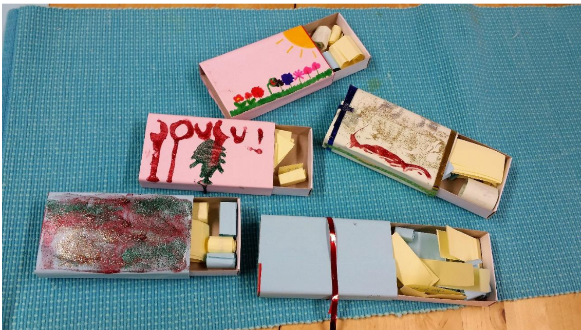
Kuvio 5: Kehulaatikot

”No se jos on paha mieli niin silloin pitää avata laatikko niin tulee parempi mieli. Et aina kun mulla on paha mieli niin mä luen sieltä niin mulle tulee parempi mieli.” Lapsi kommentoi kehulaatikon hyödyllisyyttä ja tarpeellisuutta.