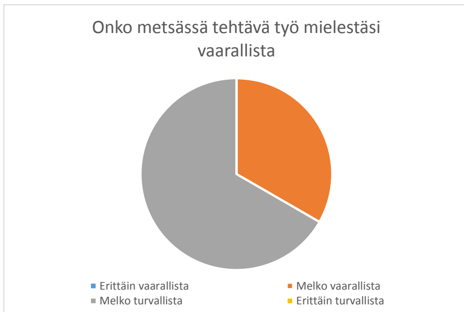
Kuvio 1. Vastaajien kokemus metsässä tehtävän työn vaarallisuudesta.

Ensimmäinen kysymys lomakkeessa oli: ”Onko metsässä tehtävä työ mielestäsi vaarallista?” Kuviosta 1. nähdään, että melko vaarallisena metsätyötä piti neljä (33,3 %) kappaletta vastaajista ja melko turvallisena kahdeksan (66,6 %) vastaajaa. Kukaan vastaajista ei pitänyt metsätyötä erittäin vaarallisena tai erittäin turvallisena.