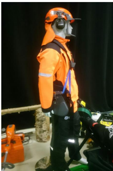
Kuva 1. Nykyaikainen raivaussahapuku.

Metsätyöntekijän vaatetuksessa käytetään usein puuvillaa ja sekoitekankaita. Työasuja löytyy erilaisilla ominaisuuksilla varustettuina. Tästä esimerkkinä ovat vettähylkivät, mutta silti hengittävät niin sanotut ”älykankaat”. Lisäksi kangasmaateriaaliin on mahdollista saada esimerkiksi palamattomuus- ja homesuojaominaisuus erilaisilla kemikaalin käsittely- ja kankaankudontatavoilla. Ammattikäytössä tärkeää olisi huolehtia, että työvaatteet eivät ole loppuun kuluneita, koska käsittelyn vaikutukset häipyvät vähitellen kankaista käytössä. Vaatteiden käyttömäärä säätelee niiden käyttöikä. Nykyaikaiset keinokuidusta valmistetut varusteet eivät ime kosteutta, mutta esimerkiksi retkeilyasut voivat syttyä helposti ja palaessaan aiheuttavat vaaratilanteen. (Aulio 2000.)