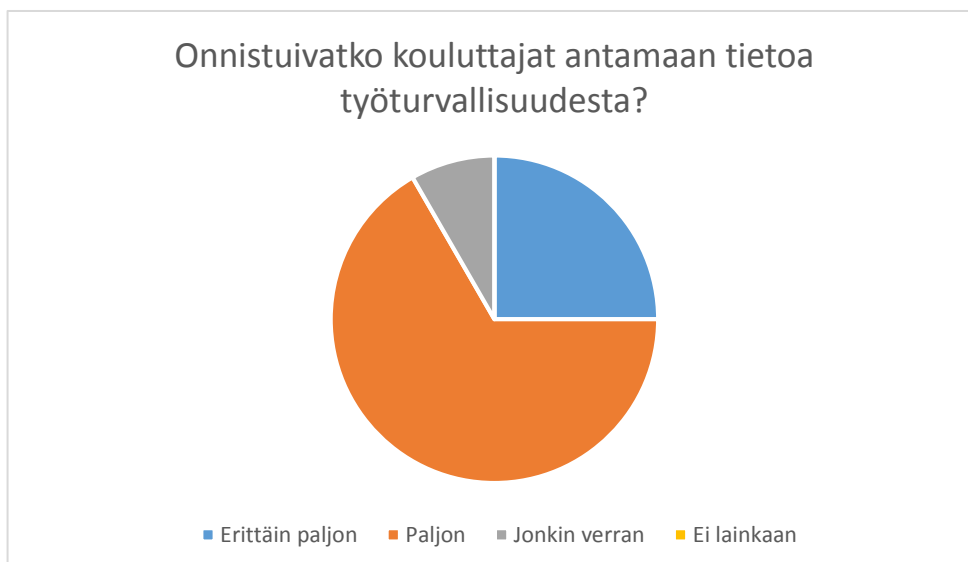
Kuvio 4. Vastaajien kokemus oppituntien pitäjien onnistumisessa työturvallisuusopetuksen osalta.

Seuraava kysymys kartoitti myös vastaajien kokemusta koulutuksen hyödyllisyydestä. Kysymykseen ”Onnistuivatko kouluttajat antamaan tietoa työturvallisuudesta?” vastauksissa hajontaa oli hieman enemmän. Kuten kuvioista 4. nähdään, kolme vastaajaa (25 %) oli ympyröinyt vaihtoehdon ”Erittäin paljon”, kahdeksan vastaajaa (66,6 %) vaihtoehdon ”Paljon” ja yksi vastaaja (8,3 %) ”Jonkin verran”.