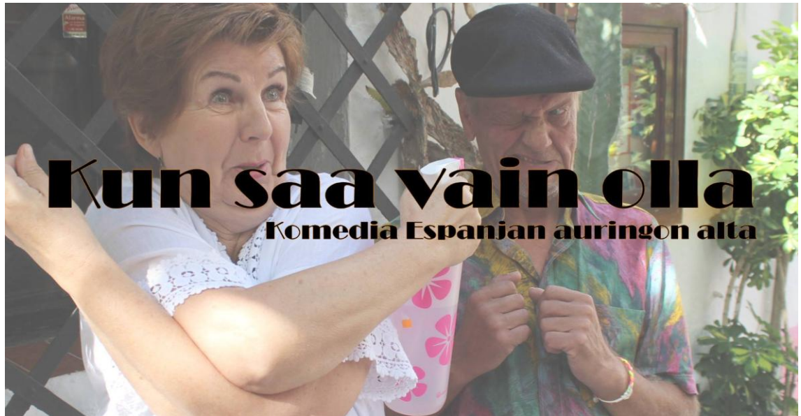
Kuva 2 Kun saa vain olla -esitysbanneri (Facebook 2017.)

nalle ruikuttamaan. Katsomopaikkoja oli esityksestä riippuen 75–96. Kokonaisuudessaan lipputulot olivat vajaa 3700 euroa, ja tulot jaettiin näyttelijöiden, ohjaajien sekä ravintolan kesken.