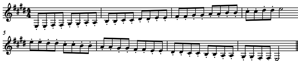
Kuvio 4. Kielitysharjoitus, E-duuri

Soitan asteikot aloittaen E-duurista ja edeten siitä ylöspäin niin korkealle, kuin se tuntuu helpolta eikä aiheuta puremista.