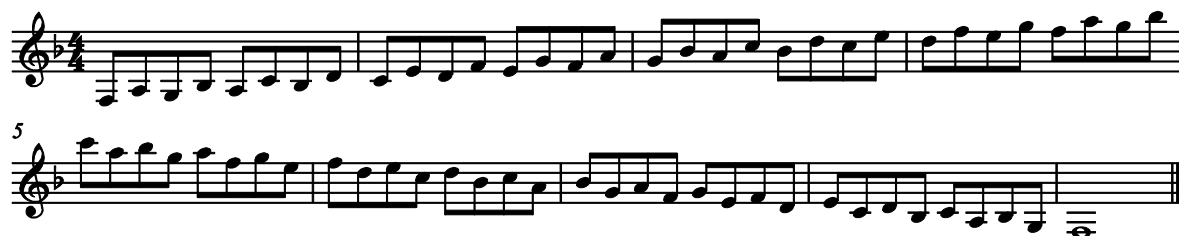
Kuvio 3. F-duuriasteikko murrettuna

Itse aloitan lämmittelyt soittaen duuriasteikot murtaen. Tässä esimerkki F-duurista, joka on helppo opettaa myös oppilaille ensimmäisenä (kuvio 3).