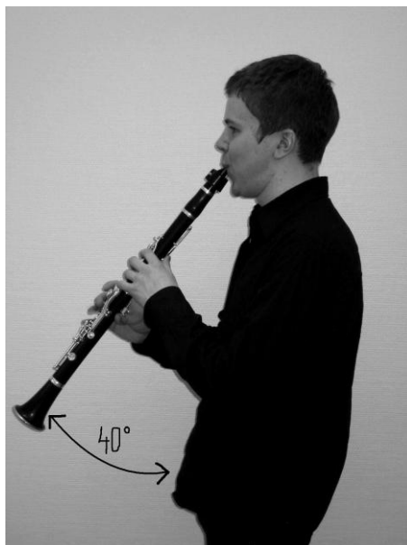
Kuvio 1. Kuva klarinetistista klarinetti oikeassa kulmassa, kuvaan piirretty asteet.