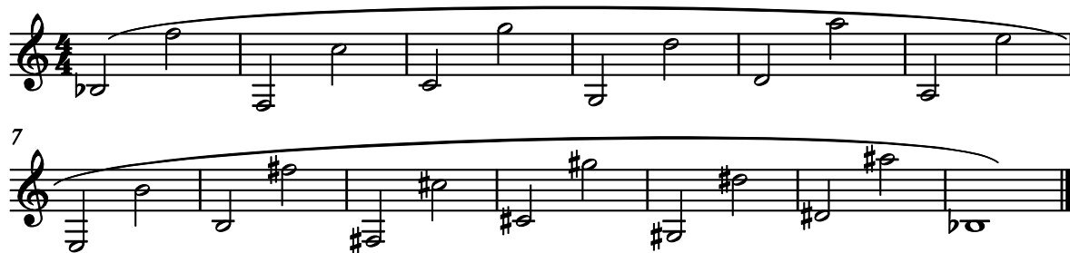
Kuvio 6. Kvinttikierto

Lopuksi, kun ääni alkaa olla auki ja lihakset tuntuvat mukavan lämpimiltä ja joustavilta voin soittaa vielä pitkiä ääniä. Soitan joko kvinttikiertoa (kuvio 6) tai oktaaveja viritysmittarin kanssa.