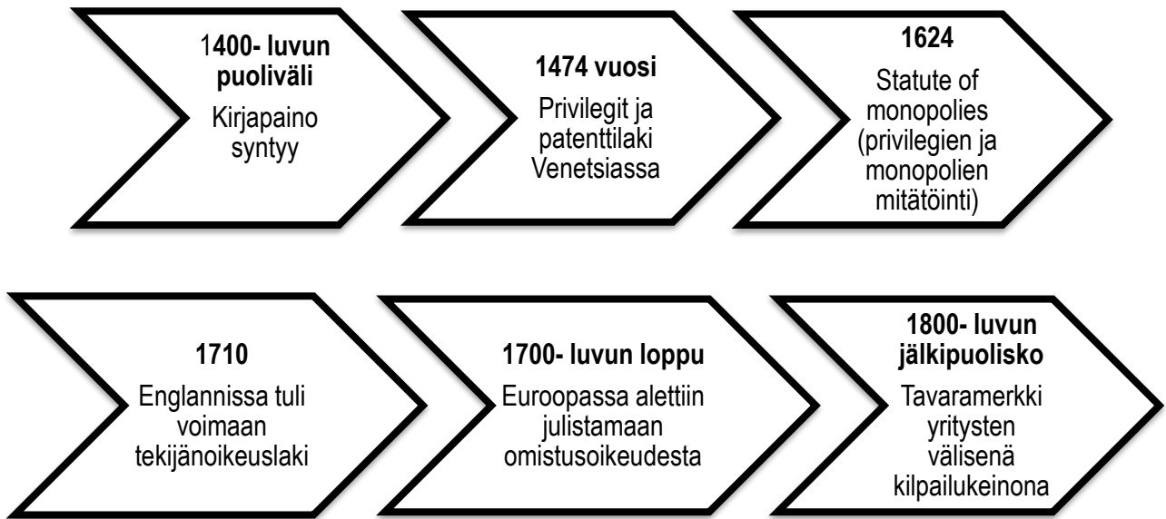
KUVIO 1. Tekijänoikeuden kehittyminen ja historia

Myöhempi immateriaalioikeuksien kehitys voidaan katsoa tapahtuneen Ranskan vallankumouksen ja USA:n perustuslain säätämisen ansiosta. Euroopan mantereella alettiin 1700-luvun lopulla julistamaan, että jokaisella säveltäjällä, kirjailijalla, taiteilijalla sekä jokaisella uuden keksinnön keksijällä tulisi olla luontainen ja omistusoikeuden kaltainen oikeus keksintöönsä ja teokseensa. Amerikan perustuslakiin otettiin vuonna 1787 säännös, joka valtuutti suojaamaan keksijöitä sekä tekijöitä määräaikaikaisella yksinoikeudella. (Haarmann & Mansala 2012, 22.)