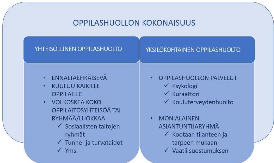
Kuvio 1 Oppilashuollon kokonaisuus

toimia, joilla edistetään oppilaiden psyykkistä, fyysistä ja sosiaalista hyvinvointia, sosiaalista vastuullisuutta, sujuvaa vuorovaikutusta sekä osallisuutta. Yhteisöllinen oppilashuolto on koko kouluyhteisön yhteinen asia. (Vt. L 1287/2013, §3-§4.) Yhteisöllinen oppilashuolto on laaja käsite ja sen toimet voivat kohdistua koko oppilaitosyhteisöön, yksittäiseen oppilasryhmään tai luokkaan (kt. kuvio 1).