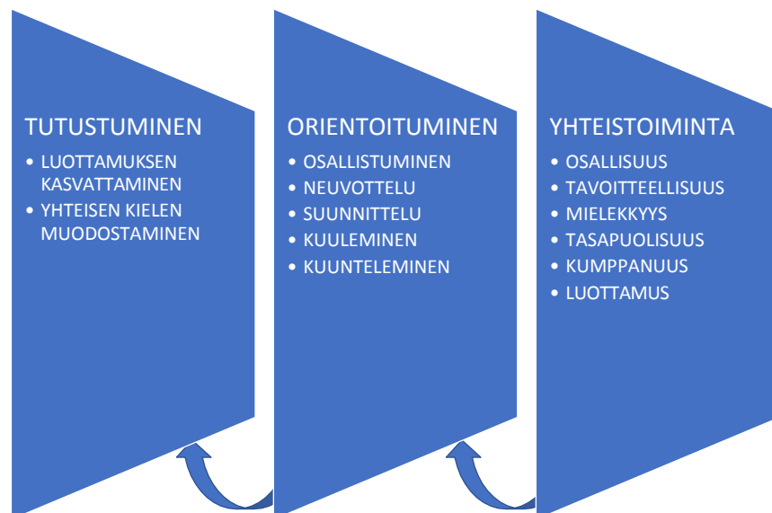
Kuvio 4 Yhteistutkimisen prosessi

Yhteistutkimusryhmän tapaamisia oli kevään mittaan kahdeksan. Näiden tapaamisten aikana syntyneitä ryhmän sisäistä yhteistyötä ja keskeisiä tekijöitä kuvaan kuviossa 4 yksinkertaisella prosessimallilla.