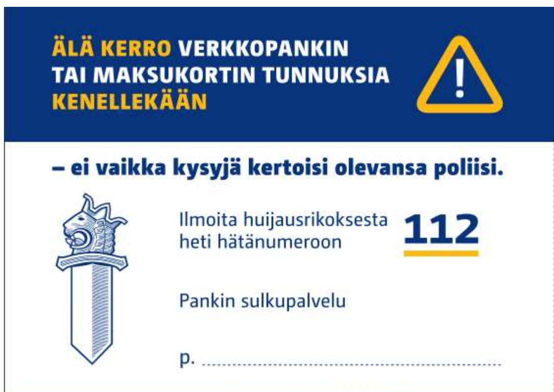
Kuva 2. Poliisin ohjetarra. (Kuva: Poliisi 2017).

Verkkosivulla on myös tulostettavia ja leikattavia muistilappuja, joita voidaan kiinnittää magneetilla sopivaan paikkaan, jos staattista tarraa ei ole saatavilla. Muistilappujen sanoma on sama kuin tarroissa: Älä kerro verkkopankin tai maksukortin tunnuksia kenellekään – ei vaikka kysyjä kertoisi olevansa poliisi. (Tiainen-Broms 2017.)