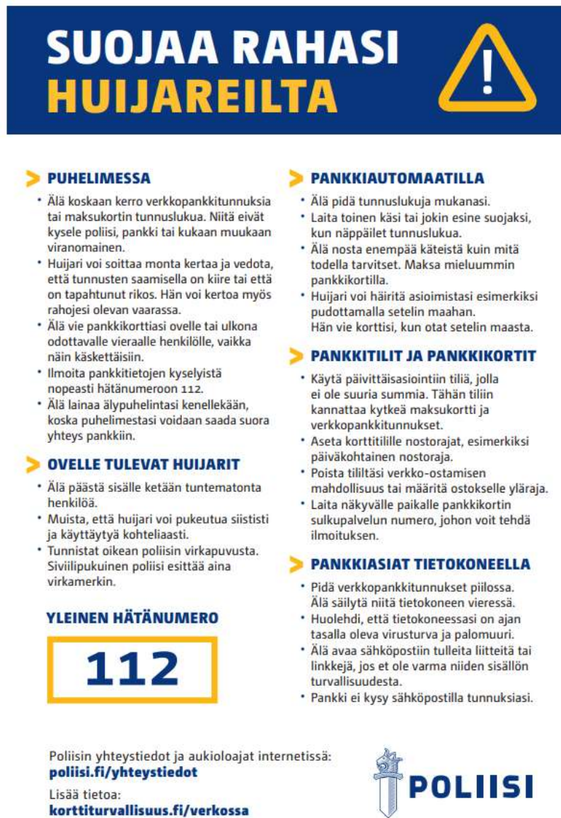
Kuva 1. Poliisin ohje rahojen suojaamisesta.

Poliisin verkkosivuilla on tietoa ilmiöstä sekä ohje, miten rahat voidaan suojata huijareilta. Ohje voidaan tulostaa ja sitä voidaan jakaa erilaisissa tilaisuuksissa tai ottaa mukaan sellaisiin tilanteisiin, joissa ollaan tekemisissä ikäihmisten tai heidän omaistensa tai hoitajien kanssa. (Tiainen-Broms 2017.)