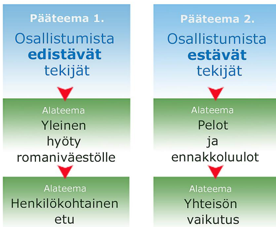
Taulukko 1. Teemat