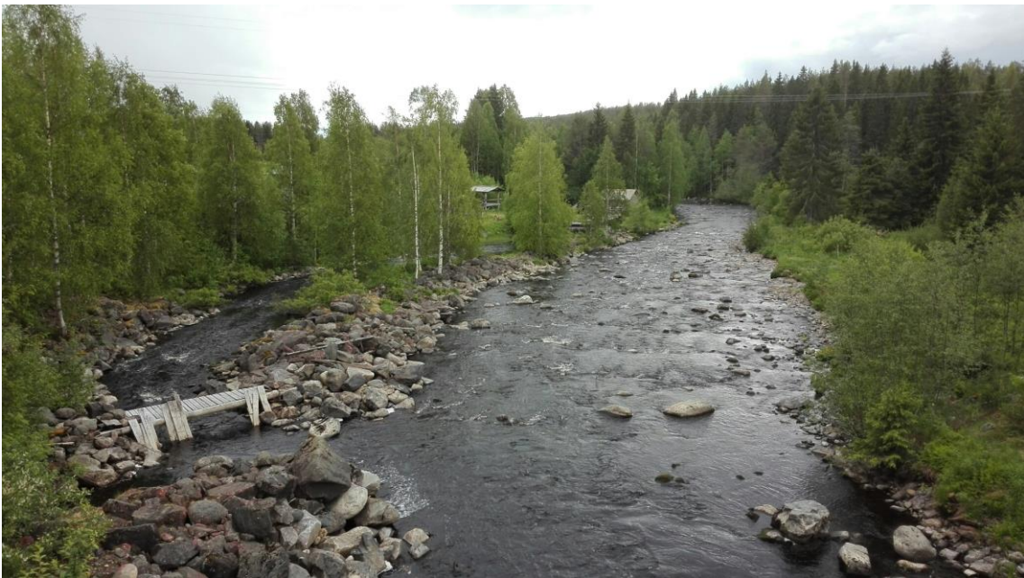
KUVIO 3. Karppalan myllyn koskinäkymä maantiesillalta. Valokuva Liisa Misikangas 2018.

Opasteet tulotielä, lähiparkkipaikka ja nuotiopaikka mainittiin useimmin myllyn käytön edellytyksistä. Esteetön kulku mainittiin vain Paltamon Rinteen myllyyn ja Puolangan Paasikosken myllyyn vastaajien näkemyksissä. Esteetön koskinäkymä (Kuvio 3) toteutui Ristijärven Karppalan ja Hyrynsalmen Komulan myllyllä. Vastaajien mukaan useilla myllyillä oli mahdollisuus kalastukseen ja virkistäytymiseen retkeilyreitillä. Myllärintuvan vuokraus oli mahdollista yhdellä kohteella.