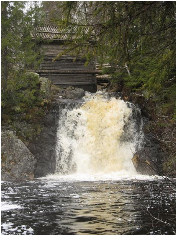
KUVIO 6. Komulan myllyn koski.

Avoin kysymys ideoista myllyn tulevaisuuden suhteen toi vahvasti esiin myllyjen arvostuksen. Mylly koettiin jo olemassaolollaan arvokkaaksi kulttuuriperinnöksi. Toimintana mainittiin retkeilykohde, matkailu ja yhteiset tapahtumat. Myllyä ympäröivä luonto ja kulttuurimaisema mainittiin arvokkaana ja toivottiin niiden hyödyntämistä matkailussa (Kuvio 6). Korjaamistarve nousi tämänkin kohdan vastauksissa runsassanaisesti esille. Varsinaisesti uusia ideoita ei noussut esiin.