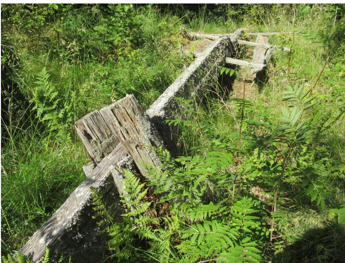
KUVIO 2. Huovilan tuulimyllyn pudonnut siipi. Valokuva Liisa Misikangas 2018.

Myllyjen kehittämis- ja korjaustoimien suhteen kunnostusten puute (Kuvio 2) viiden vuoden jaksolla nousi vastauksissa merkittävästi esiin. Toisaalta kunnostus, perinnetiedon kokoaminen ja muu hanke oli toteutettu osalla myllyistä. Kunnostuksista mainittiin katon, padon ja huoltorakennusten korjaus ja kevyet ympäristön siistimistyöt. Avoimissa vastauksissa mainittiin Museoviraston rahanpuute ja Senaattikiinteistön osalta, ettei lupaa korjauksiin ole saatu.