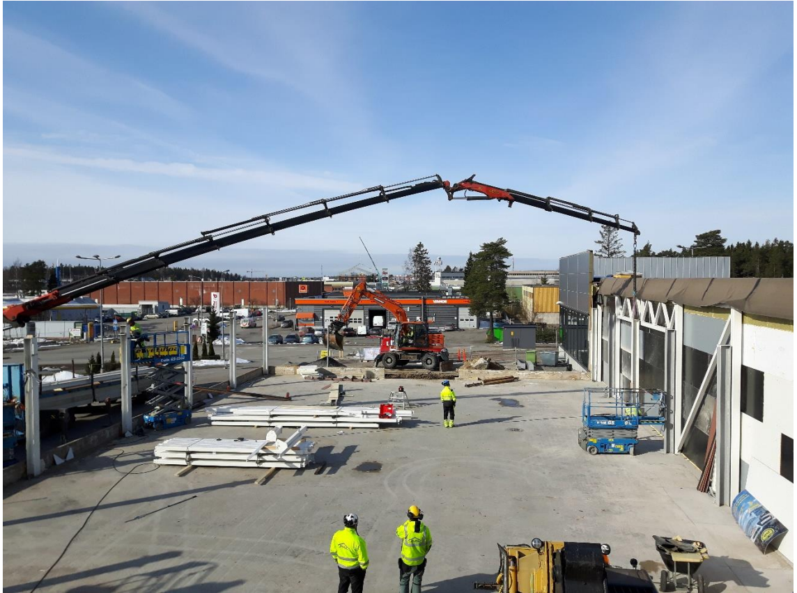
Kuva 3. Uudet teräsristikot asennettiin käyttäen HIAB-kuormanosturia.

auton lavalta ja vieressä oli käytössä oleva pihatie, missä liikenne oli ajoittain erittäin vilkasta. Työmaan toisella puolella valmiissa hallissa oli myös henkilökuntaa ja asiakkaita, joten taakka ei saanut mennä myöskään uuden osan yläpuolelle. Ristikoiden asennuksen aikaan alapuolella työskentely oli myös kielletty kokonaan.