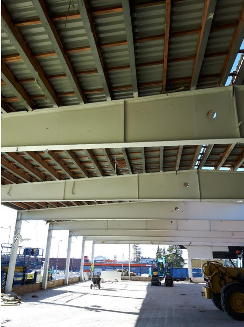
Kuva 1. Vanha vesikattorakenne kun alapuoliset villat on purettu.

Alapuolelta tehtävän purun jälkeen siirryttiin vesikaton päälle purkamaan rakennuksessa katteena ollut pelti. Koko lappeen pituiset pellit katkaistiin kolmeen osaan puukkosahalla ja niputettiin kuormalavojen päälle. Ruoteisiin tehdystä reilun kokoisesta n. 4 x 5 m:n aukosta kattopeltiniput voitiin nostaa suoraan alas ja kuljettaa jätelavalle käyttämällä yrityksen omaa kurottajaa.