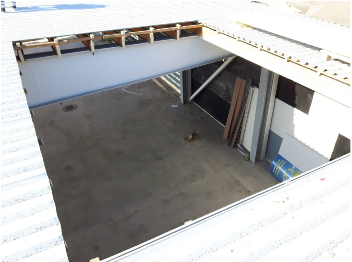
Kuva 2. Rakenteeseen tehty aukko kattopeltien alas nostamiseen.

Riisutun kattorakenteen ainoana jäykistävä osana oli jäljellä teräspalkkien väliin pultatut puiset 200 x 50 m:n vahuiset koolaukset ja katon ruoteet. Suunnitelmana oli purkaa puiset rakenteet isompina osina kurottajan avulla suoraan jätelavalle. Kun ensimmäisten teräspalkkien välistä oli purettu puuosat toisen puolen lappeelta kokonaan ja toiselta noin puolet, havaittiin vanhoissa palkeissa vääntymistä ja työt jouduttiin keskeyttämään. Pelkona oli korkeiden harjallisten teräspalkkien kaatuminen ja säilytettävien I-profiilisten pilareiden vääntyminen. Kaatumaan lähtenyt palkki tuettiin väliaikaisesti kurottajalla ja järjestettiin kiireellinen katselmus tilanteen takia. Päätettiin, että purku toteutetaan yhteistyössä aliurakoitsijan kanssa, jonka tehtävänä oli myös vanhojen teräspalkkien purkaminen ja uusien asentaminen. Vanhat palkit tuettiin puuosien purkamisen ajaksi kuorma-autoon asennetulla HIAB-kuormanosturilla ja irrotuksen jälkeen ne lastattiin saman kuorma-auton lavetille pois vietäviksi työpäivän päätyttyä.