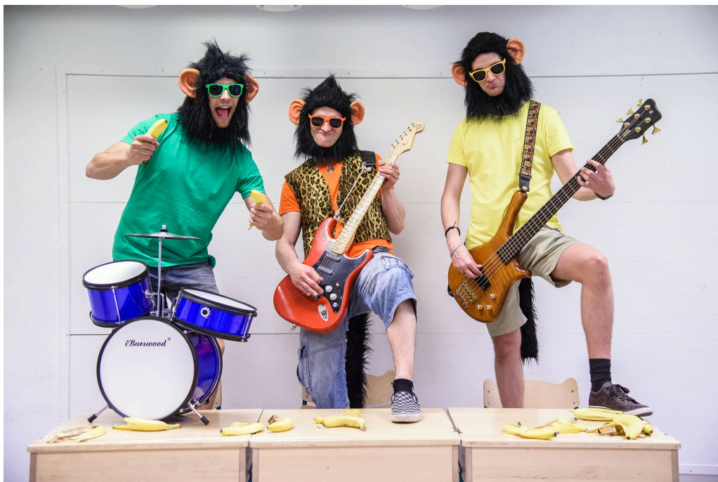
Kuva 2 (Katja Tamminen)

Biisit on sovitettu keikoilla hieman eri tavalla kuin levytyksissä. Rumpalilla on käytössä pieni rumpusetti ja hän soittaa seisaaltaan. Soittoteknisesti se luo haastetta rumpalille, mutta koemme että se sopii visuaalisesti hyvin apinoiden tyyliin. Minulla on välillä sähkökitara, mutta useimmiten akustinen kitara. Olen kokenut, että akustinen kitara keven-tää rokkibiisejä sopivasti ja ne sopivat tällöin paremmin myös pienille lapsille. Isommilla lavoilla käytän kuitenkin yleensä sähkökitaraa. Basisti soittaa sähköbassoa, mutta hän hallitsee myös kontrabasson. Keikat tehdään useimmiten sähköbassolla.