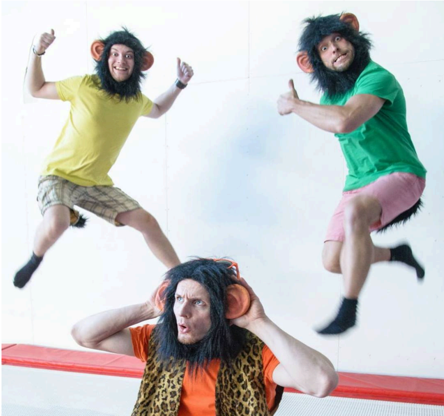
Kuva 3 (Katja Tamminen)