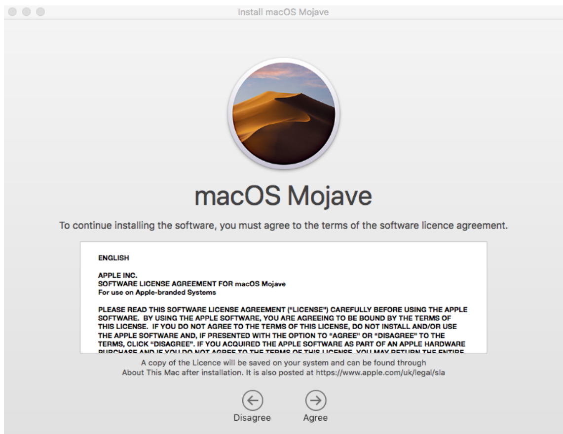
Kuva.1 MacOS Mojave–ohjelmiston asennusikkunan EULA (Apple 2018)

On yleistä, että lisenssisopimukset ovat vain digitaalisessa muodossa. Tällaisessa tapauksessa, mikäli ohjelmistoa halutaan käyttää tai sitä pystytään edes asentamaan, on EULA hyväksyttävä esimerkiksi klikkaamalla hyväksymisruutua (Kuva 1).