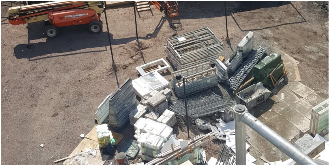
Kuva 2. Liikaa tavaraa tontilla