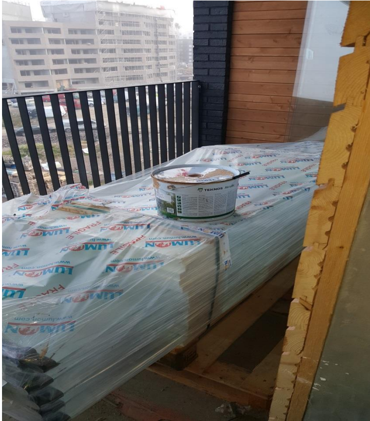
Kuva 1. Päällekkäiset työvaiheet