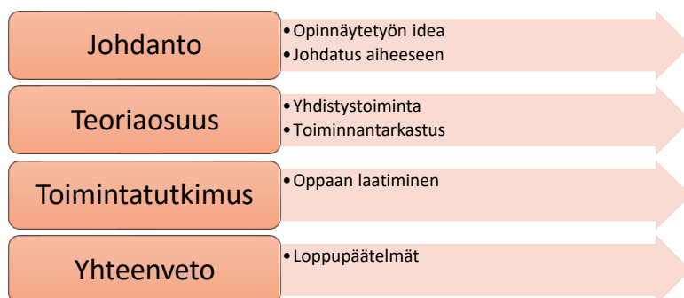
Kuvio 2 Tutkimuskuvio

Kuviossa kaksi näkyy, miten opinnäytetyön rakenne on muodostunut.