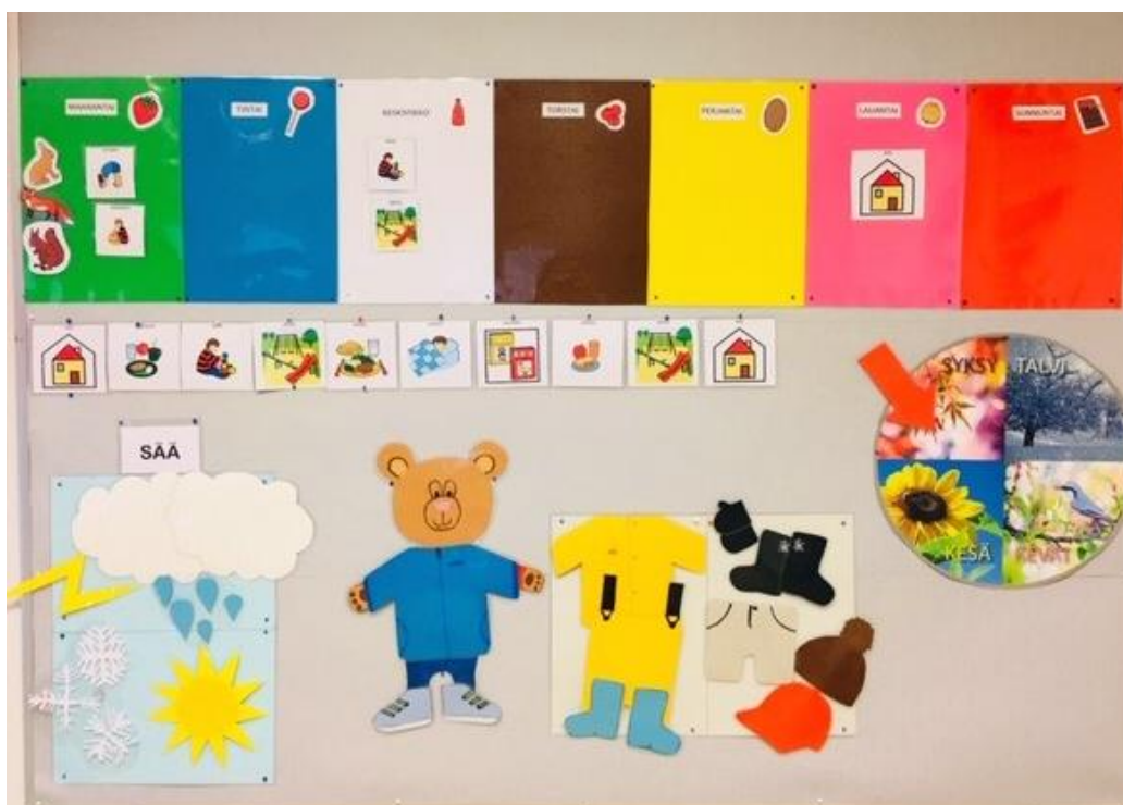
Kuva 3: Valmis taulu

huomion arvoista on se, että niistä hyötyvät todellisuudessa kaikki lapset riippumatta kielen oppimisen vaikeuksista.