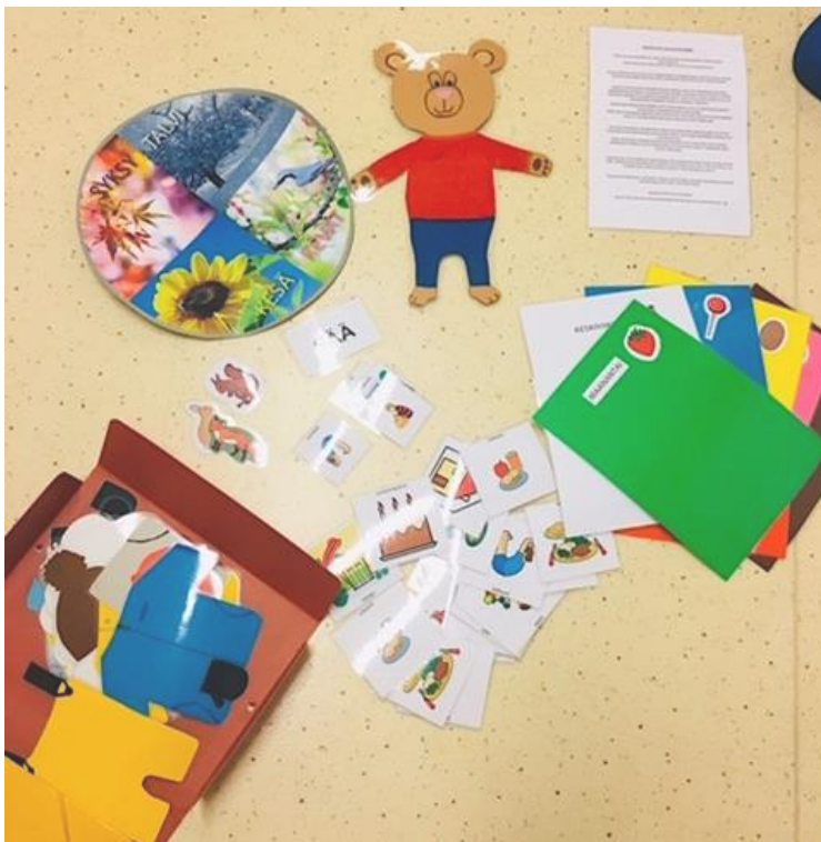
Kuva 2: Taulun suunnittelu ja toteutus vaihe

Lopullinen tuotos (Kuva 3) koostui neljästä eri kuvien kokonaisuudesta, joka sijoitettiin ryhmän salin seinään. Laminoimme jokaisen taululle tulevan kuvan, jotta ne kestäisivät kovempaakin käsittelyä. Teimme päiväkodin työntekijöille A4 kokoiselle paperiarkille ohjeistuksen taulun käyttöön (Liite 1). Ensimmäinen kuvasarja piti sisällään seitsemän A4 kokoista eriväristä paperia, joissa luki viikonpäivä sekä kuva viikonpäivään yhdistetystä asiasta esimerkiksi tiistai ja tikkari. Värit valittiin pedagogisten värin mukaan, jotka ovat yleisesti samat kaikissa varhaiskasvatus yksiköissä. Säilytimme viikonpäiville samat kuvat, jotka olivat ryhmän lapsille jo entuudestaan tutut. Lisäksi valmistimme pienet kuvat pienryhmien ”tunnuseläimistä”, joita voi siirrellä aina kunkin pienryhmän osalta oikea toiminnan kohdalle.