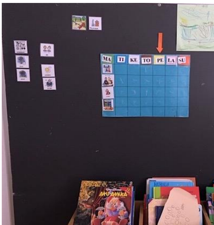
Kuva 1: Taulun lähtötilanne

Tilanne kehittämistyötä aloittaessa oli seuraava (kuva 1). Päiväkotiryhmällä oli käytössä A2 kokoinen sininen paperi, johon oli joka viikonpäivälle oma osa. Viikonpäivän kaksi ensimmäistä kirjainta luki paperin yläreunassa ja kirjaimen alla oli kyseisen päivän väri. Ryhmällä oli käytössä muutamia pieniä kuvia, jotka kuvasivat päiväkotipäivän toimintoja. Taulu sijaitsi pienryhmätalassa, jossa usein oli toimintaa ryhmän ”viskareille” eli viisivuotiaille.