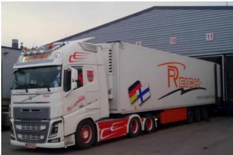
Kuva 2. Saksalaisen yhteistyökumppanin puoliperävaunu ja suomalaisen yhteistyökumppanin vetoauto (TS Logistics 2018).

Liikennöinti tapahtuu Helsingin, Kotkan ja Rauman satamista (kuva 3). Helsingin osuus yrityksen liikenteestä oli vuoden 2018 kahden ensimmäisen neljänneksen aikana 75 %, Kotkan 21 % ja Rauman 4 %. Vuoden 2018 aikana osa puoliperävaunukuljetuksista on siirtymässä Helsingistä Hangon satamaan. (Suihkonen 2018).