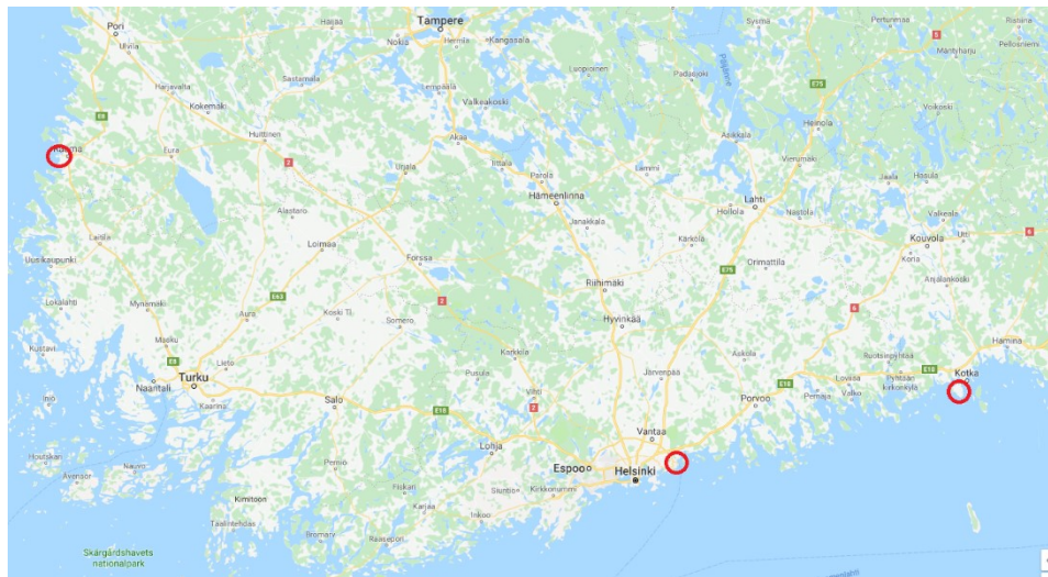
Kuva 3. Satamat, joista yritys liikennöi (Google Maps 2018).