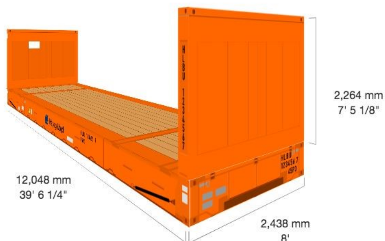
Kuva 7. Lavakontti mittoineen (Hapag-Lloyd 2018).