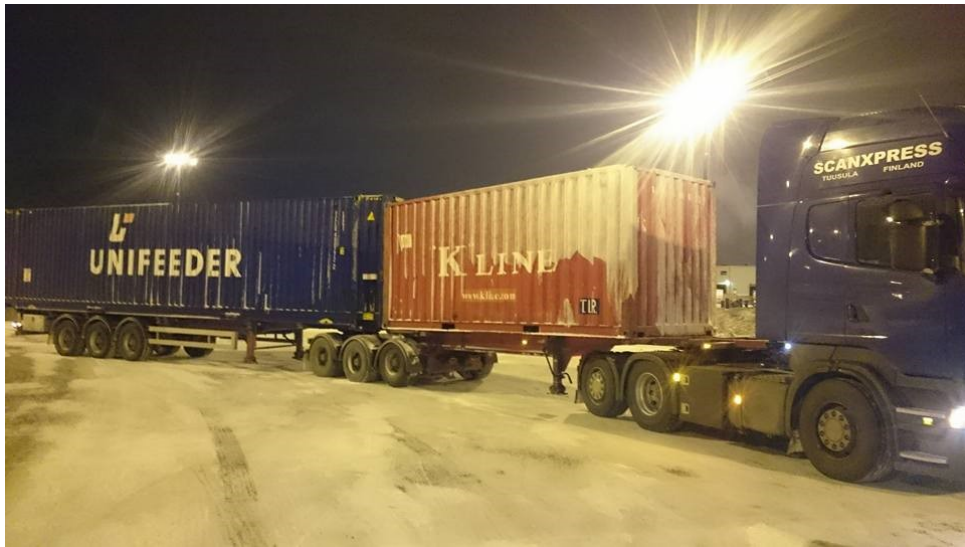
Kuva 1. Yhteistyökumppanin konttikuljetus, jossa moduuliyhdistelmässä mukana 20 ja 45 jalan kontit (TS Logistics 2018).