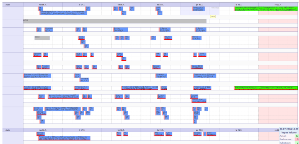
Kuva 11. LogiApps:n viikkonäkymä (Silvasti Software 2018).

lainkaan, koska LogiApps:n mobiilikäyttöliittymä on toistaiseksi saatavilla ainoastaan Android-puhelimille. Apple-versiota kehitetään parhaillaan. Yrityksessä tunnustetaan riski ohjelman mahdollisen kaatumisen aiheuttamista haitoista säilyttämällä kuljetustilaukset myös paperisina versioina.