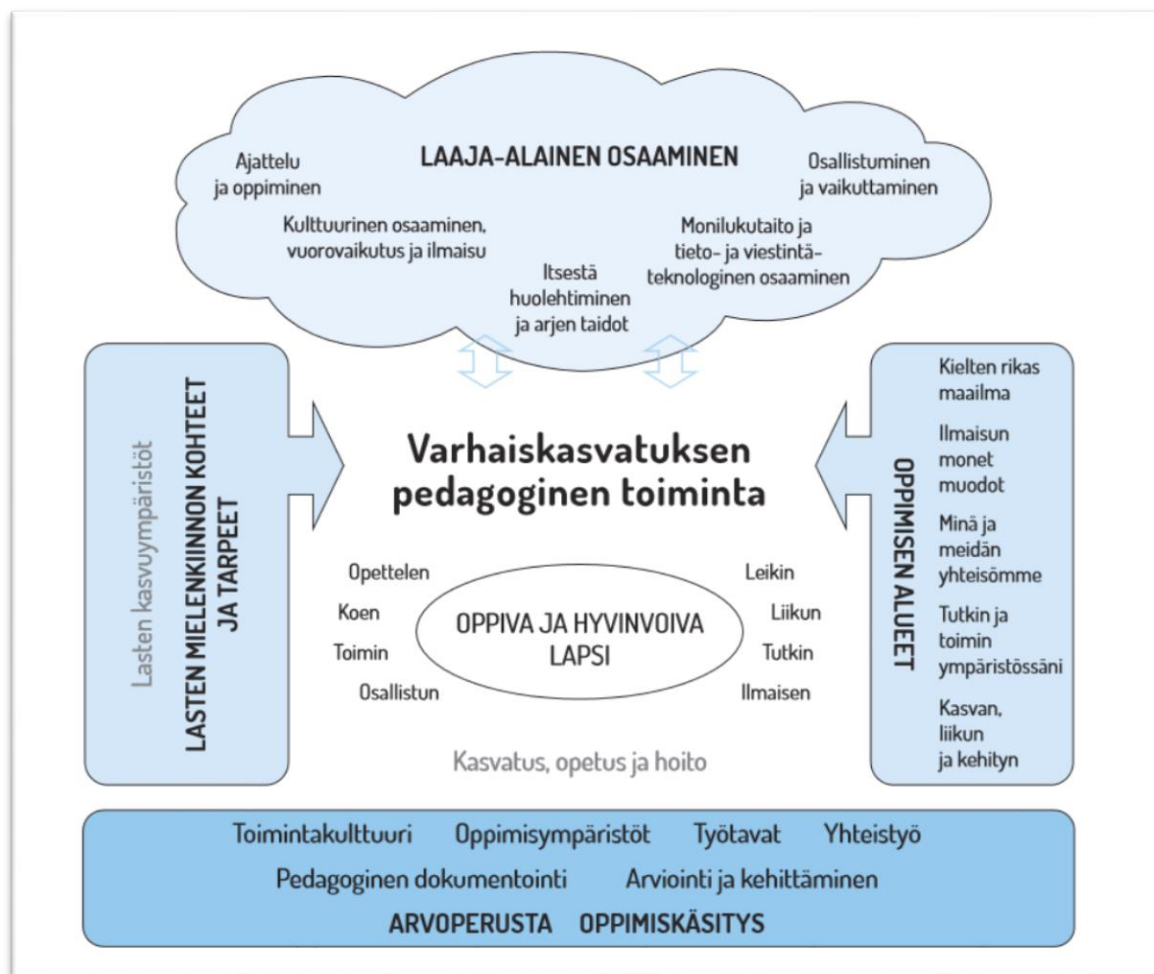
KUVIO 2. Varhaiskasvatuksen pedagogisen toiminnan viitekehys. (Opetushallitus 2016, 36.)