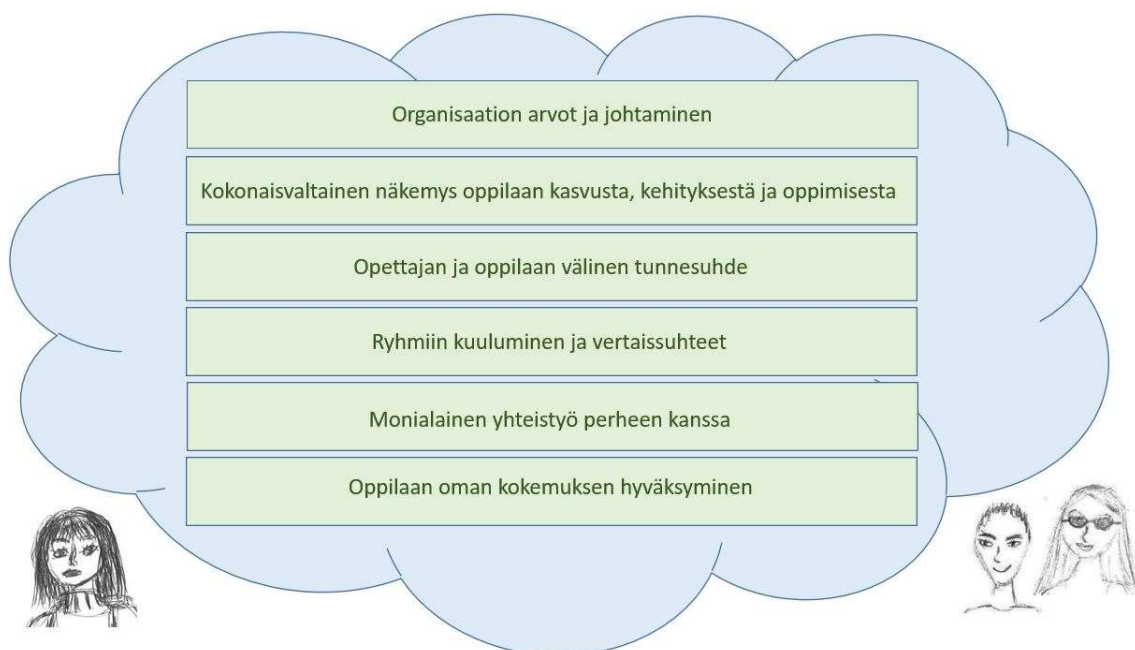
Kuvio 5. Psyykkiseen ympäristöön vaikuttavat tekijät koulussa

Tutkimuskysymyksiin saatujen vastausten kautta koulun psyykinen ympäristö ja sen merkitys emotionaalista tukea tarvitsevan oppilaan kannalta tiivistyi seuraavasti (kuvio 5.). Osa-alueita käsitellään tarkemmin seuraavassa kappaleessa 6.2 Tutkimustulosten tarkastelu.