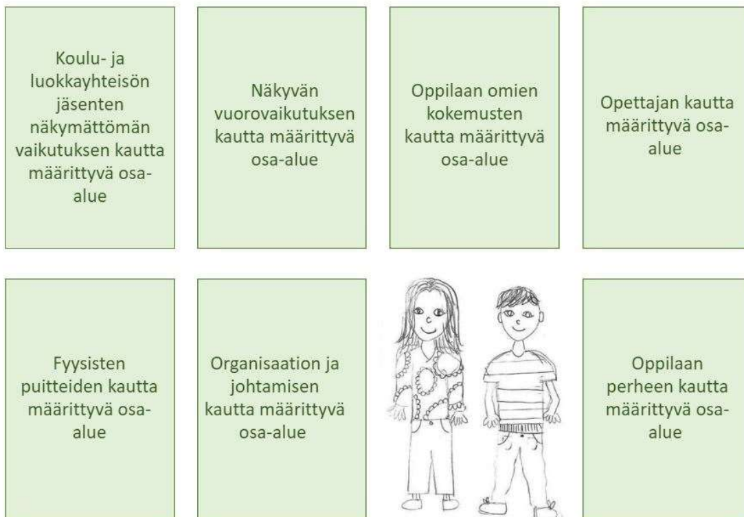
Kuvio 2. Psykkisen ympäristön osa-alueet koulussa

Ensimmäisen tutkimuskysymyksen kautta haluttiin selvittää, minkälaisia osa-alueita koulun psyykkisestä ympäristöstä on löydettävissä. Avoimella kysymyksenasettelulla haluttiin varmistaa, että kaikki alkuperäistutkimuksista nousseet näkökulmat tulevat huomioituiksi ilman ennako-oletuksia. Aineiston pohjalta esille nousi seitsemän koulun psyykkiseen ympäristöön vaikuttavaa osa-aluetta (kuvio 2): Koulu- ja luokkayhteisön jäsenten näkymättömän vaikutuksen kautta määrittyvä osa-alue, näkyvän vuorovaikutuksen kautta määrittyvä osa-alue, oppilaan omien kokemusten kautta määrittyvä osa-alue, opettajan kautta määrittyvä osa-alue, organisaation ja johtamisen kautta määrittyvä osa-alue, fyysisten puitteiden kautta määrittyvä osa-alue sekä oppilaan perheen kautta määrittyvä osa-alue.