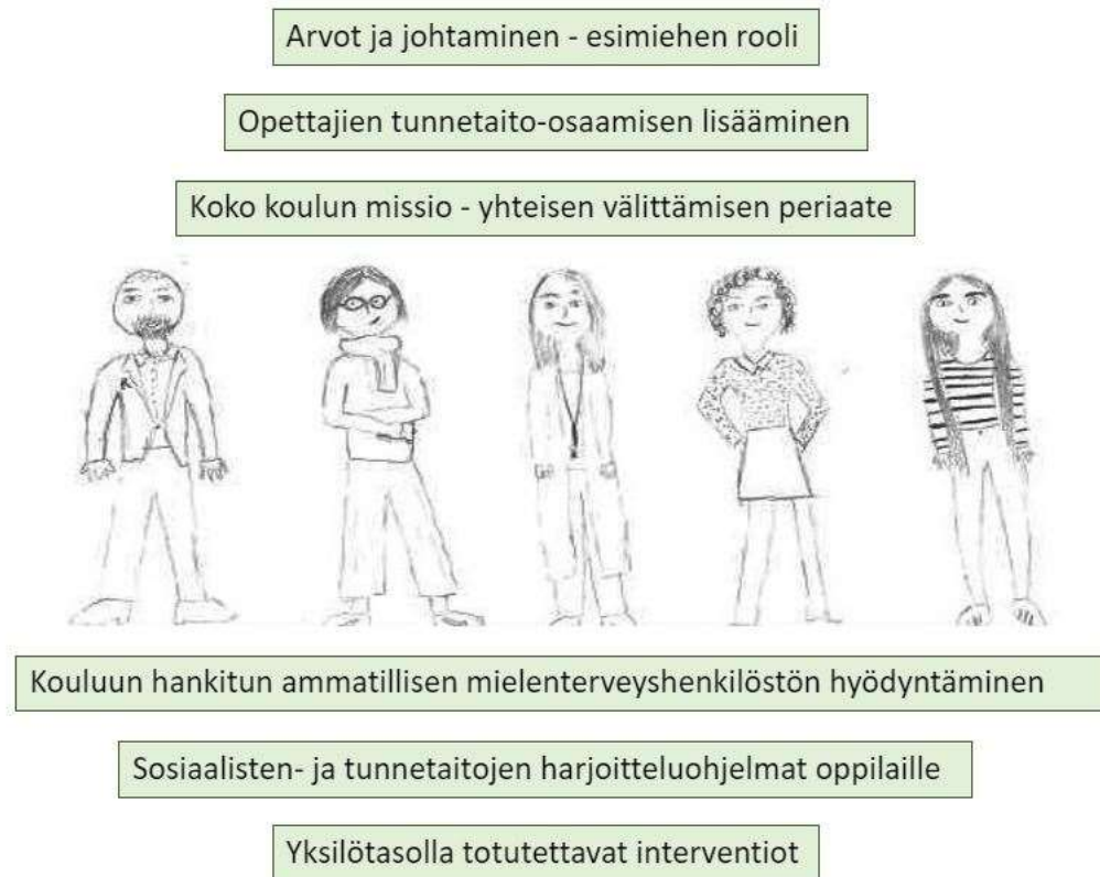
Kuvio 4. Psykkiseen ympäristöön vaikuttamisen keinot

Henkilökunnan ja oppilaiden yhteinen taitojen harjoittelu kannattelee koko koulu yhteisöä. Kouluun voidaan perustaa toimiva ”hyvinvoinnin tukiryhmä”, joka voi koostua oppilas- huollon henkilökunnasta, verkoston moniammatillisista edustajista (esim. lastenpsykiat- ria, perheneuvola), vanhemmista, jne. Hyvinvoinnin tukiryhmä voi vastata mielentervey- den ja hyvinvoinnin esillä pitämisestä kouluvuoden aikana, sekä suunnitella ja toteuttaa joko kohdennettuja interventioita tai universaaleja oppimistilaisuuksia koulun oppilaille ja henkilökunnalle. Hyväksi koettuja tapoja ovat tutkimusten mukaan myös tavoiteltavan käyttäytyminen mallintaminen, opettaminen, harjoittelu ja siitä palkitseminen mm. onnis- tumisia huomioimalla. (Caldarella ym. 2011; Webber 2017; Warin 2017; Chan ym. 2017.)