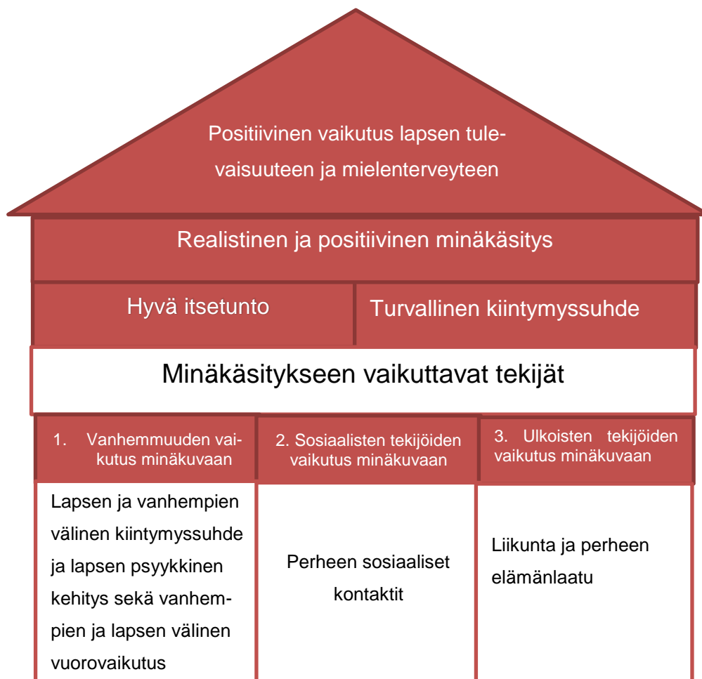
Kuvio 3. Opinnäytetyön tulosten pohdinta