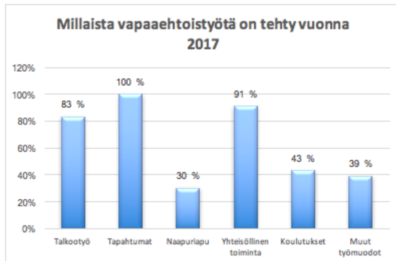
Taulukko 3. Millaista vapaaehtoistyötä tehtiin vuonna 2017. Vastaajia 23.

Taulukossa on esitetty millaista vapaaehtoistyötä kyläyhdistyksissä tehtiin vuonna 2017. Suurin osa toiminnasta oli tapahtumia ja yhteisöllistä toimintaa. Talkootyö tulee kolmantena. Yhteisöllisenä toimintana kyselyssä tarkoitettiin esimerkiksi nuorisotyötä, kyläkahvien järjestämistä sekä muita kokoontumisia.