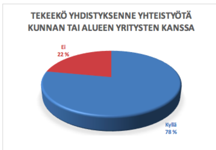
Taulukko 5. Yhdistyksen yhteistyö kunnan tai alueen yritysten kanssa. Vastaajia 23.

Suurin osa yhdistyksistä tekee yhteistyötä kunnan sekä alueen yritysten kanssa. Yksi vastaajista mainitsi yhteistyökumppaniksi myös seurakunnan. Pääsääntöisesti kunnan kanssa suunniteltiin yhteistyössä kylän kehittämistä sekä hoidettiin ulkoilupaikkoja. Talkootilaisuuksissa kunta tai alueen yritykset olivat tulleet vastaan tarjoamalla ruuat sekä välineet. Useat vastaajat kertoivat, että alueen yrittäjät ovat itsekin aktiivisia yhdistyksen vapaaehtoistoimijoita. Tietyt henkilöt haluavat määrätietoisesti pitää oman ympäristön elinvoimaisena ja siistinä, jossa myös säilyy palveluja. Osa yhdistyksistä kertoi hakeneensa pieniä avustuksia kunnalta, joita myönnetään vuosittain.