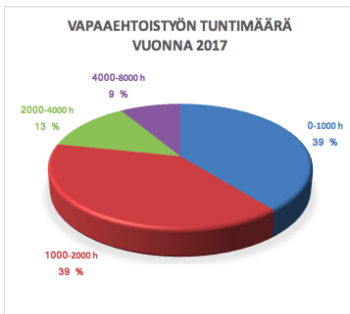
Taulukko 1. Vapaaehtoistyön tuntimäärä vuonna 2017. Vastaajia 23.

Vapaaehtoistyön määrää arvioidessa mukaan on laskettu kaikki tehty työ, kuten tal- koot, suunnittelutyö, materiaalin hankinnat, kokoukset, tapahtumat, nuorisotyö, naa- puriapu jne. Jokaisen henkilön työpanos on laskettu erikseen riippumatta siitä onko hän yhdistyksen jäsen vai ei.