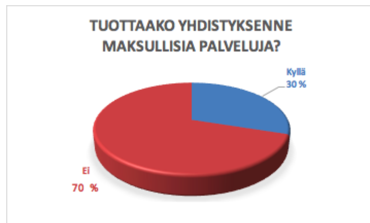
Taulukko 10. Palvelutuotanto kyläyhdistyksissä. Vastaajia 23.

Suurin osa vastaajien yhdistyksistä ei tuottanut maksullisia palveluja. 30 % kuitenkin näin teki ja tässä vastaukset koottuna.