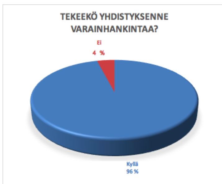
Taulukko 9. Kyläyhdistyksen varainhankinta. Vastauksia 23.