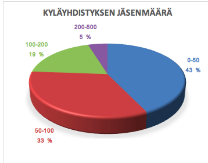
Taulukko 6. Kyläyhdistyksen jäsenmäärä. Vastaajia 21.

Suurimmalla osalla yhdistyksen jäsenmäärä pysyy alle 50:ssä henkilössä, mutta toisena tulee 50-100 jäsenen yhdistykset hyvin edustettuna myös. Kolmanneksi eniten on 100-200 jäsenen yhdistyksiä. 200-500 jäsenen yhdistyksiä oli vain 5 %, joka tarkoitti yhtä vastaajaa. Keskimäärin jokaisessa yhdistyksessä on 88 jäsentä. Tämä siis tarkoittaa sitä, että koko maakunnan kyläyhdistyksissä on jäseniä arviolta 4400 henkilöä. Vastauksissa tuli esille, että kaikilla ei ole jäsenrekisteriä eivätkä he kerää jäsenmaksuja. Tällöin jäsenistöön on ajateltu kuuluvan koko kylän asukkaat, joka tarkoittaa tiettyä maantieteellistä aluetta.