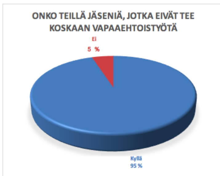
Taulukko 8. Onko kyläyhdistyksessä jäseniä, jotka eivät tee vapaaehtoistyötä. Vastauksia 21.