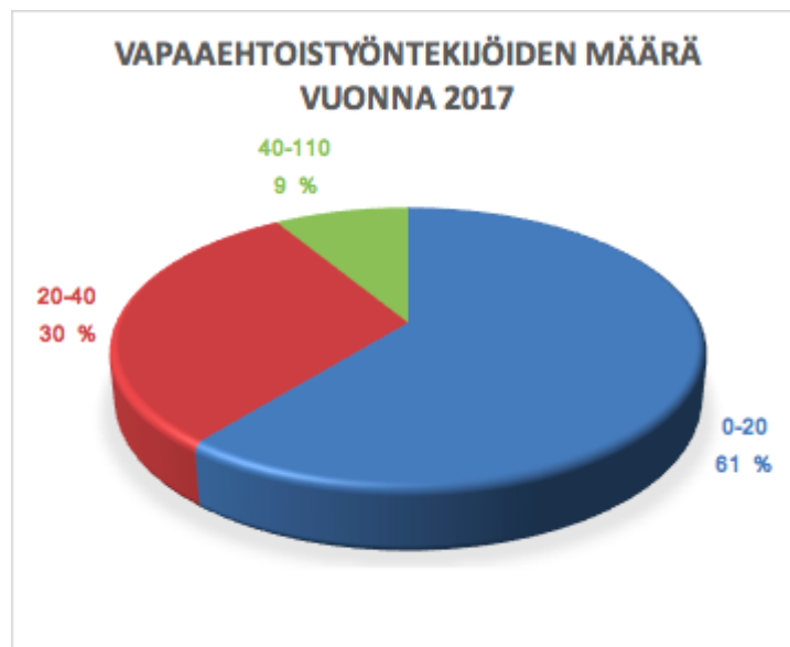
Taulukko 2. Vapaaehtoistyöntekijöiden määrä vuonna 2017. Vastaajia 23.