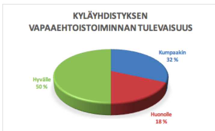
Taulukko 4. Kyläyhdistyksen vapaaehtoistyön tulevaisuus. Vastaajia 23.

Vastaajista puolet kertoi, että toiminnan jatkuvuus näyttää positiiviselta ja omalla toiminnalla sitä voidaan edesauttaa. Vastauksista nousi esille, että vanhojen tekijöiden tulee osata uudistua. Esimerkiksi nuorempi sukupolvi ei välttämättä arvosta jäykkiä kokouksia ja pitkäjänteistä työtä, vaan he odottavat mahdollisuuksia pop up -toimintaan.