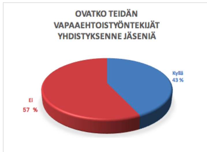
Taulukko 7. Ovatko vapaaehtoistyöntekijät kyläyhdistyksen jäseniä. Vastaajia 23.

Kolme vastaajista ilmoitti, ettei hallituksen lisäksi ole muita jäseniä, vaan koko kylä kuuluu tarkemmin erittelemättä jäsenistöön. Kaksi vastaajista ilmoitti hallituksen kooksi 8 henkilöä, jotka suunnittelevat toiminnan eikä muita virallisia jäseniä ole yhdistyksessä.