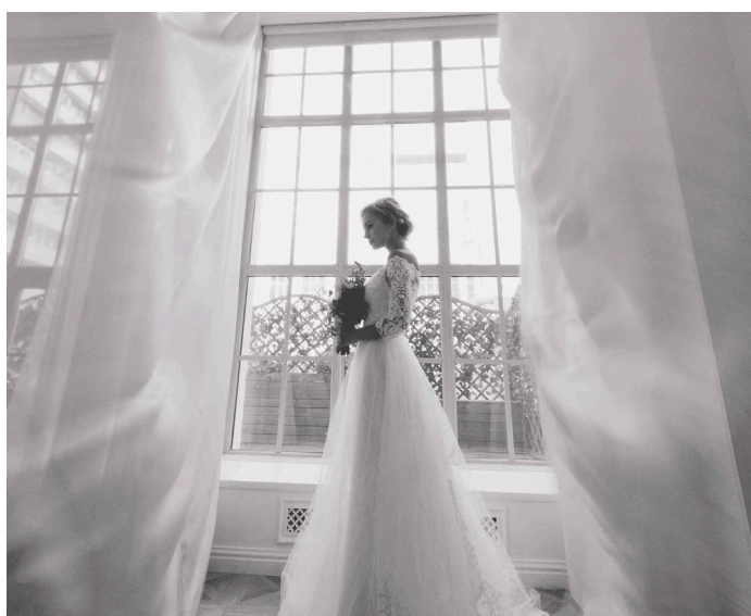
KUVA 12. Pitkä valotusaika, kuvassa 1/13 s.

Hääkuvauksessa suosittelisin kokeilemaan muotokuvauksessa pitkien valotusaikojen käyttöä. Nykytekniikan avulla pystytään kuvaamaan myös käsivaralla käyttäen pitkiä valotusaikoja ja sen vuoksi ei välttämättä tarvitse kuljettaa mukanaan jalustoja. Hääkuvauksessa tämän tehokeinon käyttäminen onnistuu paremmin esimerkiksi morsiamen hunnun, häämekon pitkän laahuksen tai esimerkiksi sisätiloissa verhojen kanssa laajakulmaobjektiviä käyttämällä (kuva 12). Olen kokeillut pitkiä valotusaikoja studio-olosuhteissa. Jatkossa on tarkoitus kuvata näitä enemmän myös studion ulkopuolella.