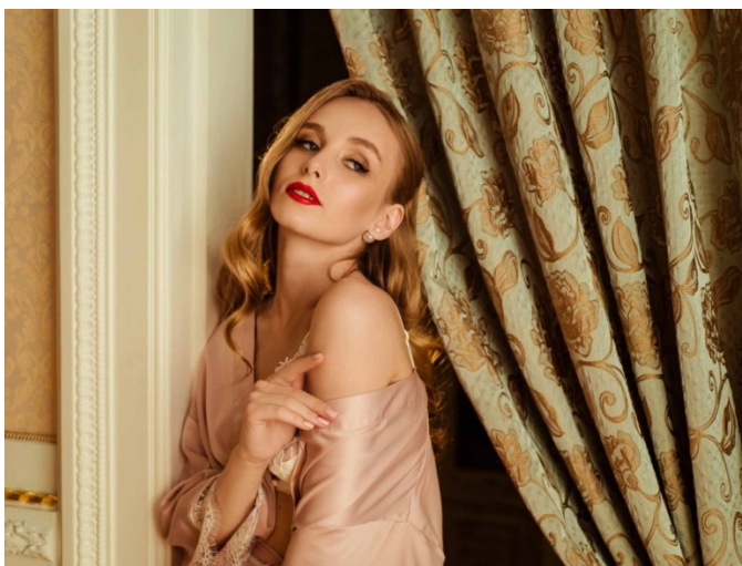
KUVA 8. Esimerkki valaisimen käytöstä hiusvalona.

LED-paneelin lisäksi nykypäivän hääkuvauksessa on käytössä valaisimien muodossa olevat valot. Valaisimia käytetään pääosin joko taustavalona tai hiusvalona (kuva 8). Valaisimia on mahdollista käyttää myös hyvin luovasti erilaisissa tilanteissa (kuva 9).