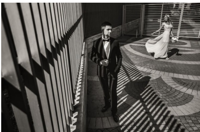
KUVA 11. Geometrian, rytmin ja symmetrian käyttö kuvassa.

Kuvasta tulee entistä parempi, jos näkymässä on jokin kohde, johon katse kiinnittyy. Tehokkaina sommittelukeinoina valokuvauksessa pidetään johdattelevien linjojen käyttöä, rytmin ja erilaisten toistuvien muotojen käyttöä. Hääkuvauksessa on mahdollista käyttää paljon geometrisia muotoja kuten erilaisia linjoja: polkuja, teitä, rakennusten seiniä ja muita luonnollisia linjoja. Kun perussommitelun säännöt ovat hallussa, voi siirtyä edistyneiden sommittelusääntöjen tutkimiseen ja soveltamiseen omassa työssään (kuva 11).