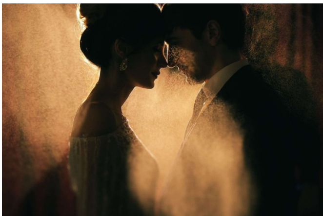
KUVA 9. Esimerkki valaisimen luovasta käytöstä (Kuvaja: Kemran Shiraliev, v. 2018, kuva on mukana tekijän luvalla).