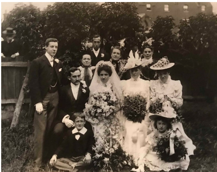
KUVA 3. Hääseurue puutarhassa (Kuvaaja: F.J. Mortimer, noin v. 1900).

Värifilmit ilmestyivät 1900-luvun alkupuolella, mutta monet hääkuvaajat jatkoivat työskentelyä mustavalkofilmillä värifilmien nopean haalistumisen vuoksi (Prophotos.ru 2010). Sen vuoksi 1930-luvulle saakka hääkuvat olivat pääosin mustavalkoisia, kunnes vuonna 1932 saksalainen yritys Agfa toi markkinoille Agfacolor-nimiseen värifilmien. Kehittynyt teknologia antoi mahdollisuuden tallentaa kameralle myös enemmän liikettä sisältäviä kuvia sekä spontaaneja, nopeasti vaihtuvia tilanteita.