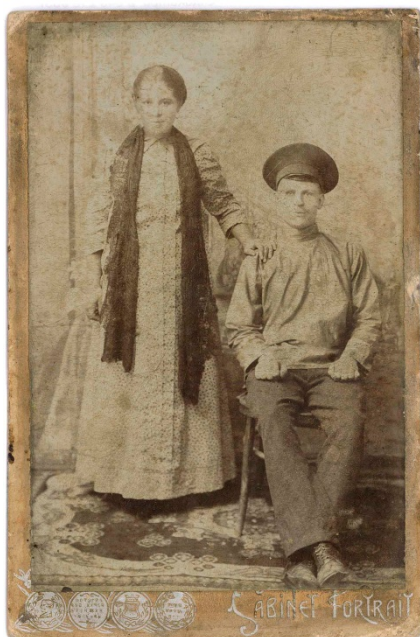
KUVA 1. Hääkuva pariskunnasta. Tutkijan isoisoäiti ja isoisoisä (Kuvaaja: tuntematon, v. 1917).

nettujen huoneiden ulkopuolella. Kuvan muodostamiseksi hääparin tuli seistä paikallaan useamman sekunnin ajan. Tämän tyyppinen kuvaus oli harvemmin mahdollista toteuttaa hääpäivänä, joten kuvissa hääpari oli pukeutuneena parhaimpiinsa muttei hääpukuihin (kuva 1). (Prophotos.ru 2010.)