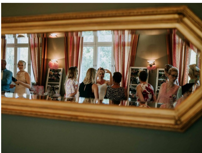
KUVA 14. Kehyksen käyttö sommitelukeinona.

Yhtenä tehokeinona myös hääkuvauksessa voidaan pitää rajausta eli kehysten käyttöä. Objektien sijoittaminen kehykseen ohjaa katsetta kuvan sisään ja näin ollen kehys auttaa katsetta pysymään kuvan sisällä. Kehyksiä löytyy joka puolelta ja niitä voi käyttää runsaasti sommitelman parantamiseksi dokumentaarissa hääkuvauksessa (kuva 14).