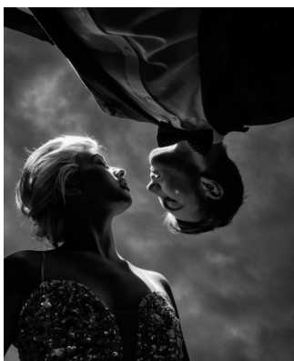
KUVA 15. Äärimmäinen kuvauskulma alaperspektiivistä.

Äärimmäisten kuvauskulmien käyttöä on esiintynyt valokuvissa yli 100 vuoden ajan, lähinnä arkkitehtuurissa. Ensimmäisenä valokuvaajana, joka alkoi käyttää äärimmäisiä kuvauskulmia laajemmin, pidetään Alexanderia Rodchenkoa. Äärimmäisten kuvauskulmien kuvauksen kanssa kannattaa olla tarkkana ihmisiä kuvatessa. Hääkuvauksessa se on varteenotettava vaihtoehto – kuvia voi ko- keilla ottaa ala- tai yläperspektiivistä (kuva 15).