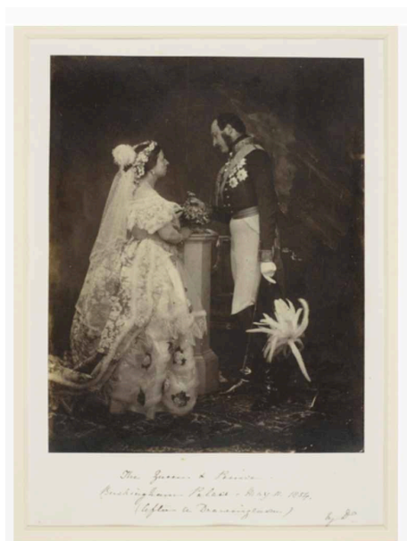
KUVA 2. Hääkuva kuningatar Victoriasta ja prinssi Albertista.