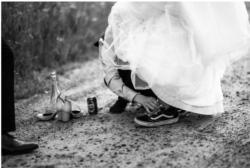
KUVA 13. Harhaanjohtaminen.

Yhtenä tehokeinona myös hääkuvauksessa voidaan pitää rajausta eli kehysten käyttöä. Objektien sijoittaminen kehykseen ohjaa katsetta kuvan sisään ja näin ollen kehys auttaa katsetta pysymään kuvan sisällä. Kehyksiä löytyy joka puolelta ja niitä voi käyttää runsaasti sommitelman parantamiseksi dokumentaarissa hääkuvauksessa (kuva 14).