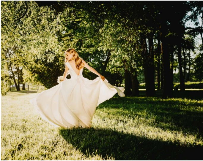
KUVA 5. Sivuvvalo.

Kun valo valaisee kohteen taustan toimien taustavalona, puhutaan vastavaloon kuvaamisesta. Taustavalo piirtää kuvattavan kohteen ääriviivat erottaen ne selkeästi kuvassa. Tämän tyyppisen valon avulla erilaisten pintojen rakenne saadaan parhaiten näkyviin. Vastavalon kuvaamista käytetään usein reportaasikuvauksessa sekä ihmisten että erilaisten tilanteiden ja hetkien vangitsemisessa (kuva 6).