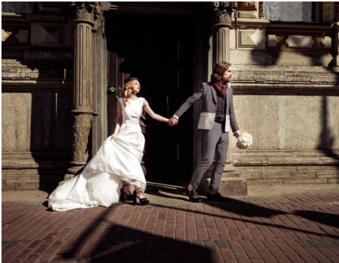
KUVA 4. Suora valo.

tössä täytyy siis muistaa, mitkä ovat valoa hajottavia ja toisaalta vahvistavia elementtejä. Vallitsevan valon arvioinnin jälkeen on löydettävä kuvaussuunta. Valon suunta voi tuolloin olla suora, sivuvalo tai taustavalo. Kameran suunnalta tuleva valo on suoraa valoa ja tekee kuvattavasta kohteesta litteän ja varjottoman. Kolmiulotteisuus puuttuu tällaisesta kuvasta. Tämän tyyppistä valoa ei suositella. Suorassa valossa ei suositella otettavaksi lähi- tai puolivartalokuvia ihmisistä. Paras vaihtoehto on sijoita ihmisiä johonkin kaupunki- tai muuhun miljööseen ja suunnata katseet pois päin kamerasta ja suorasta auringon valosta (kuva 4).