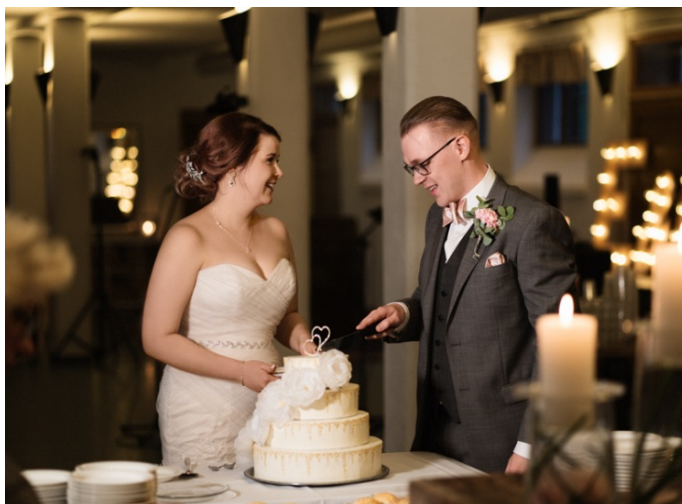
KUVA 7. Esimerkki LED-paneelistä ja sen käytöstä.

LED-paneelin lisäksi nykypäivän hääkuvauksessa on käytössä valaisimien muodossa olevat valot. Valaisimia käytetään pääosin joko taustavalona tai hiusvalona (kuva 8). Valaisimia on mahdollista käyttää myös hyvin luovasti erilaisissa tilanteissa (kuva 9).