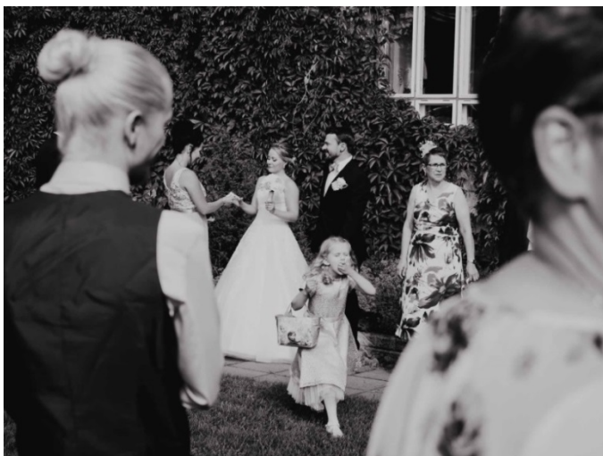
KUVA 10. Monikerroksinen sommitelma.

Kuvasta tulee entistä parempi, jos näkymässä on jokin kohde, johon katse kiinnittyy. Tehokkaina sommittelukeinoina valokuvauksessa pidetään johdattelevien linjojen käyttöä, rytmin ja erilaisten toistuvien muotojen käyttöä. Hääkuvauksessa on mahdollista käyttää paljon geometrisia muotoja kuten erilaisia linjoja: polkuja, teitä, rakennusten seiniä ja muita luonnollisia linjoja. Kun perussommitelun säännöt ovat hallussa, voi siirtyä edistyneiden sommittelusääntöjen tutkimiseen ja soveltamiseen omassa työssään (kuva 11).