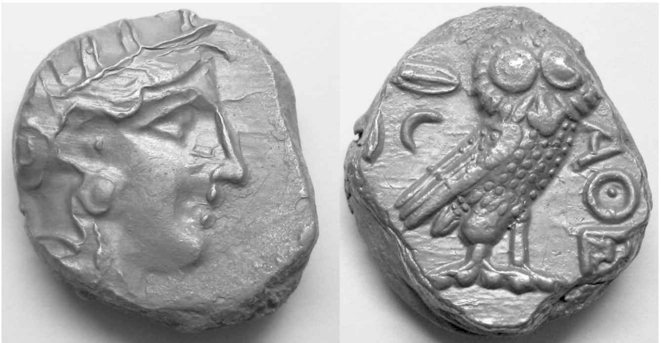
Kuva 3. Persia, Aleksanterin valtakunnan Mesopotamia. Tetradrakma satraappi Mazakesin lyöttämänä 331 – 322 eKr. Paino 17,22 g.

Näillä rahoilla olikin Egyptin alueella ja jopa kauempanakin niin suuri merkitys rahaliikenteessä, että satakunta vuotta myöhemmin, Aleksanteri Suuren valloittua Lähi-Idän maat Persia mukaan lukien lyöttäti Aleksanterin valtakunnan Mesopotamian satraappi Mazekes 331 – 322 eKr. Ateenan pöllötetradrakman imitaatioita. Rahat olivat hyvää hopeaa ja aidon painoisia, mutta ne olivat alkuperäistä hieman krouvimpaa tekoa.