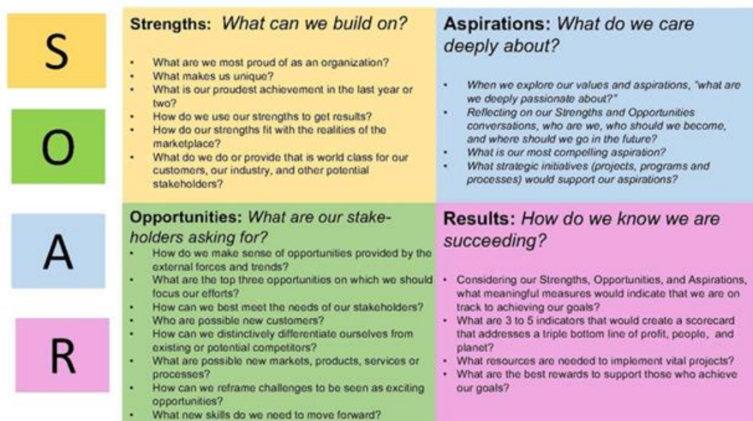
Kuva 2. SOAR-analyysi (Stavros & Hinrichs 2009, University of Missouri Libraries 2018 mukaan)