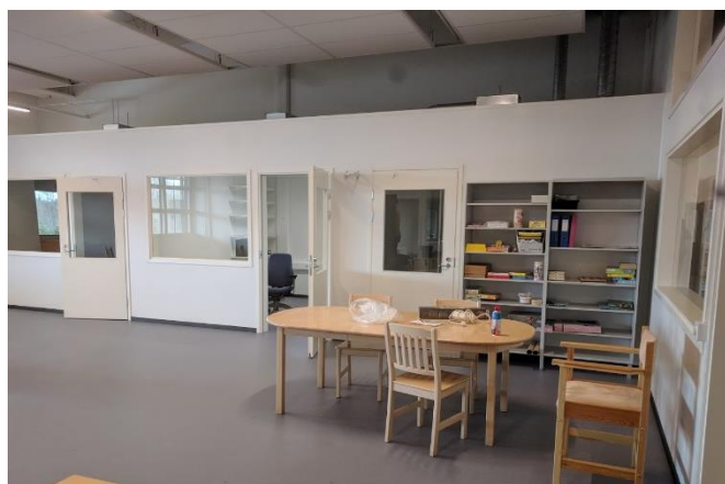
Kuva 3. Päivätoiminnan tila

Huhtikuussa hankimme tavaroita, työasuja ja muita tarvikkeita päivätoimintaan. Opin- näytetyöhön liittyvät kehittämistehtävät vaativat yhteistä pohdintaa siitä, miten kir- jaamme asiakkaiden toiveet ja valinnat ylös opinnäytetyötä varten sekä toimintaamme varten: opinnäytetyöhön voimme kirjata vain ne, jotka ovat siihen ilmoittaneet suos- tumuksensa mutta muiden mielipiteet tulee myös huomioida käytännön työssä mutta eivät tule osaksi opinnäytetyötä. 19.4.2018 uusien tilojen lopputarkastus meni läpi ja 30.4.2018 alkoi loppujen tavaroiden pakkaaminen ja tavaroiden vienti uusiin tiloihin. Tavaroiden pakkaamiseen, siirtämiseen ja paikoilleen asetteluun oli varattu aikaa kaksi viikkoa. Samalla alkoi päivätoimintatilojen järjesteleminen. Työtoiminnan asi- akkaat aloittivat uusissa tiloissa työskentelynsä 16.5.2018. Toimintamme alettua uu- sissa tiloissa Naulan työkeskus muutti nimensä Toimintakeskus Toimelaksi. Ongel- mitta emme ole myöskään selvinneet muun muassa tilaamamme magneettitaulu on ollut kolmeen kertaan rikki sen saadessamme sekä pukuhuonetiloissa olevalle sängylle ei ollut saatavilla sähköä. Jotta voisimme järjestää monipuolista ja laadukasta toimin- taa, tavarahankintoja vielä puuttui. Tiloistamme puuttui kodikkuus sekä tarvittavaa materiaalia oli vielä vähän, kuva 3. Päivätoiminnan tila.