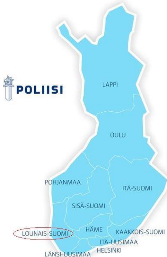
Kuva 2: Poliisilaitokset Suomessa.

Viranomaisradioverkko eli Virve. Viranomaisten, kuten poliisin ja pelastustoimen, käyttämä suojattu radioverkko. Mahdollistaa viranomaisten sisäisen viestinnän sujuvasti sekä mahdollisuuden ottaa toiseen viranomaiseen yhteyttä ja muodostaa puheryhmiä esimerkiksi yhteisillä tehtävillä.