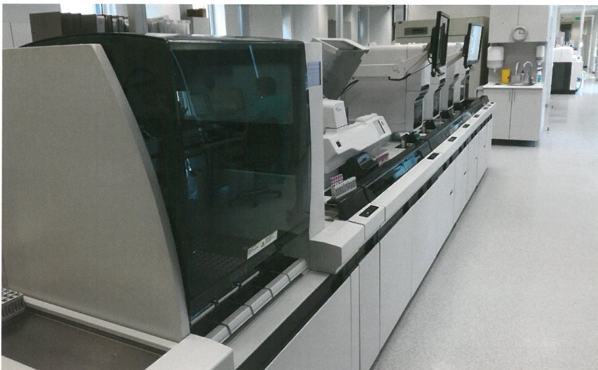
Nykyaikaista laboratorioanalytiikkaa Gulbja laboratorijassa, Riiassa.