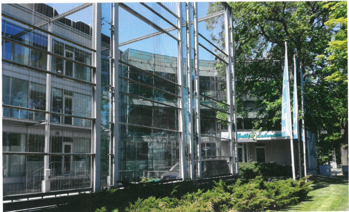
Gulbja laboratorijan toimitiloja kelpaa katsella myös ulkopuolelta.

järjesti Latvian yhteistyökoulu P. Stradins Medical College of the University of Latvia. Saimme tutustua opastetulla kierroksella päätoimipisteen logistiikkaan ja analytiikkaan. Testipaneeleihin ja laboratoriomäärityksiin sekä hinnoitukseen kannattaa tutustua mielenkiinnosta yhtiön kotisivuilla ( https://www.egl.lv/en/tests/ ).