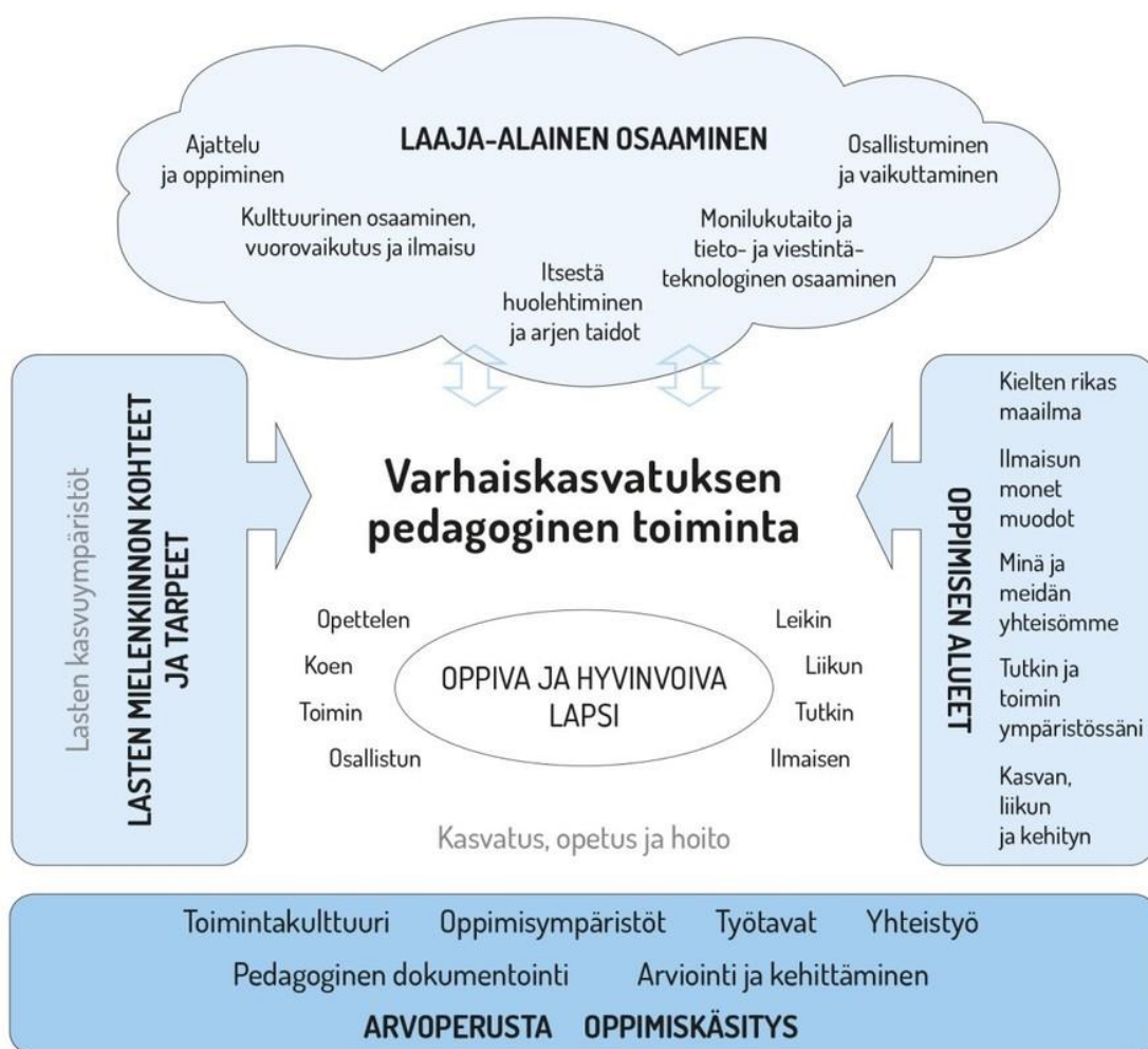
KUVIO 1. Varhaiskasvatuksen pedagogisen toiminnan viitekehys (OPH 2018.)

Laaja-alaisen osaamisen kehittämiseen vaikuttavat lapsen hyvinvoinnin ja oppimisen tukeminen, eri- laiset oppimisympäristöt sekä varhaiskasvatuksen toimintamuodot. Laadukas pedagoginen toiminta edistää lapsen laaja-alaista osaamista. Osaamisen tavoitteet huomioidaan oppimisympäristöissä, toi- minnan suunnittelussa, kasvatuksessa, opetuksessa ja hoidossa. (OPH 2016, 22.)