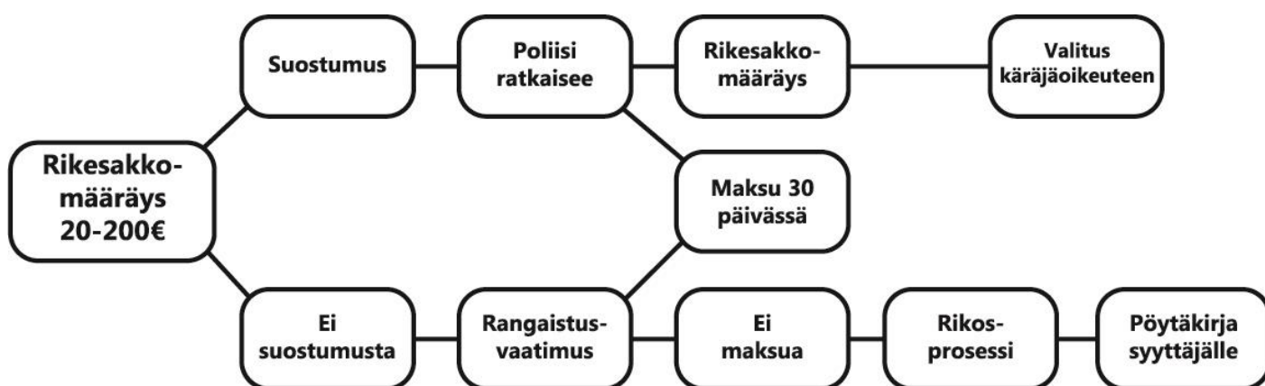
Kaavio 3. Rikesakkomääräyksen prosessi.

Rikesakkoa ei voida määrätä pienestä rikkomuksesta silloin, jos asianomainen teollaan osoittaa piittaamattomuutta tai välinpitämättömyyttä tieliikennesäännöksiä tai määräyksiä kohtaan (HE 180/2017 vp, 105). Rikesakkomenettelyä voidaan soveltaa vain sellaisissa virallisen syytteen alaisissa rikkomuksissa, jossa rangaistus on enintään sakko tai kuusi kuukautta vankeutta. Rikkomuksen tulee olla sellaisissa tilanteissa kuitenkin konkreettisesti vähäinen. (Tapani 2016, 204–206.)