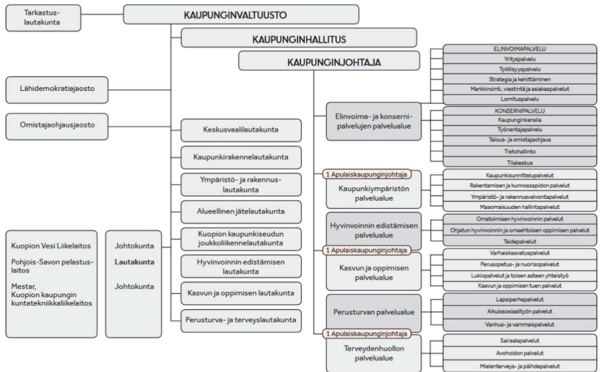
Kuva 1 Kuopion kaupungin organisaatio (Kuopion kaupunki 2019).