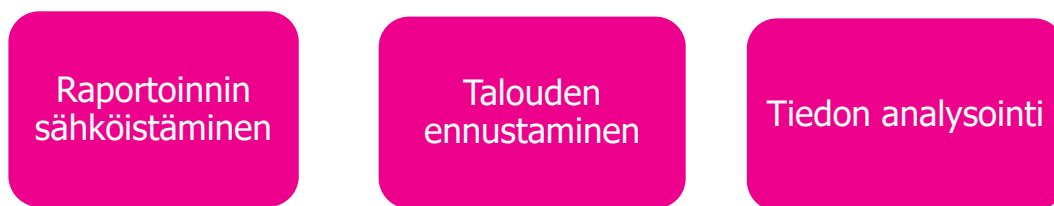
Kuva 3 Kuopion kaupungin tiedolla johtamisen keskeisimmät kehityskohteet