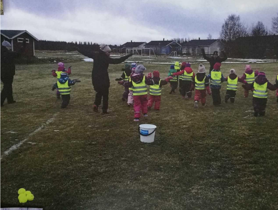
KUVA 2. Liikuntaleikkejä lähiliikunta-alueella