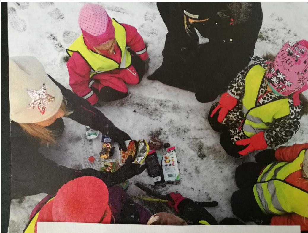
KUVA 1. Roskanäyttely piha-alueella

Pedagogista toimintaa toteutettiin kokoontumalla ryhmän tiloihin keskustelemaan edelliskerran toiminnosta ja keskustelimme ryhmän kanssa vastuullisesta toimimisesta luonnossa, millaiset roskat eivät kuulu luontoon. Osallistuminen toimintaan ympäristön puolesta on ympäristökasvatuksen osana arvokasvatuksellista näkökulmaa (Raittila 2016, 2019). Keskustelussa nousi esille karkkipaperit ja muovipussit, joita lapset osasivat nimetä luontoon kuulumattomiksi. Kerroimme ryhmälle tulevasta roskajahdistista, joka päättyy roskanäyttelyyn (KUVA 1). Tällä tavoin päästään lapsen tavoitteisiin tutkimisen ja leikin kautta.