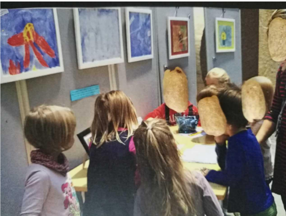
KUVA 3. Taidenäyttely Kokkolan kaupungin kirjastossa