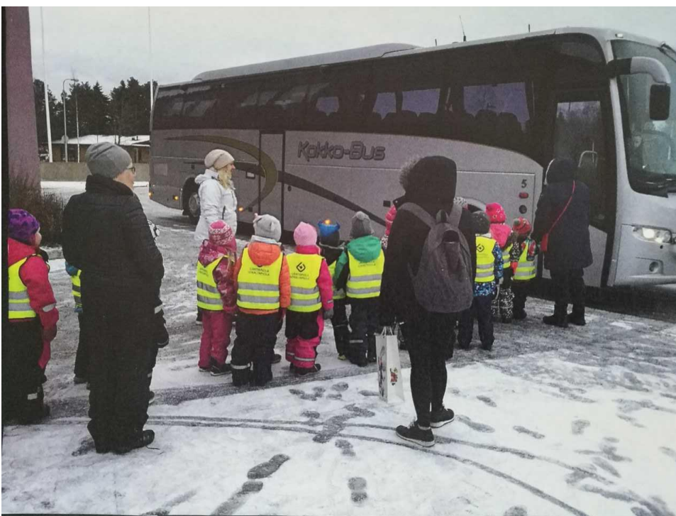
KUVA 4. Kaupunkiympäristöön tutustuminen linja-auto kyydityksellä

Ammatillista kasvua lisäsi verkostoyhteistyö. Samaa vuosikurssia suorittava opiskelija toteutti omaa opinnäytetyötään varhaiskasvatukseen, minkä myötä sovimme yhteisen intervention lasten oikeuksien viikolla Kokkolan kaupunginkirjastoon. Tällä tavoin saimme harjaannuttaa laajemmin yhteistä suunnittelua. Kaupungin budjetti oli ylittynyt kuljetusten suhteen, joten me opinnäytetyön tekijöinä saimme järjestettyä kuljetuksen päiväkodilta Kokkolan kaupunkiin. Lähetimme sähköpostia kokkolalaisille kuljetusalan yrittäjille tiedustellen, olisiko heillä kiinnostusta lähteä tukemaan lasten osallistumista kulttuuritapahtumaan lasten oikeuksien viikolla. Sponsoriksemme osoittautui Kokkobus Ab, jonka kautta kyyditys toteutui.