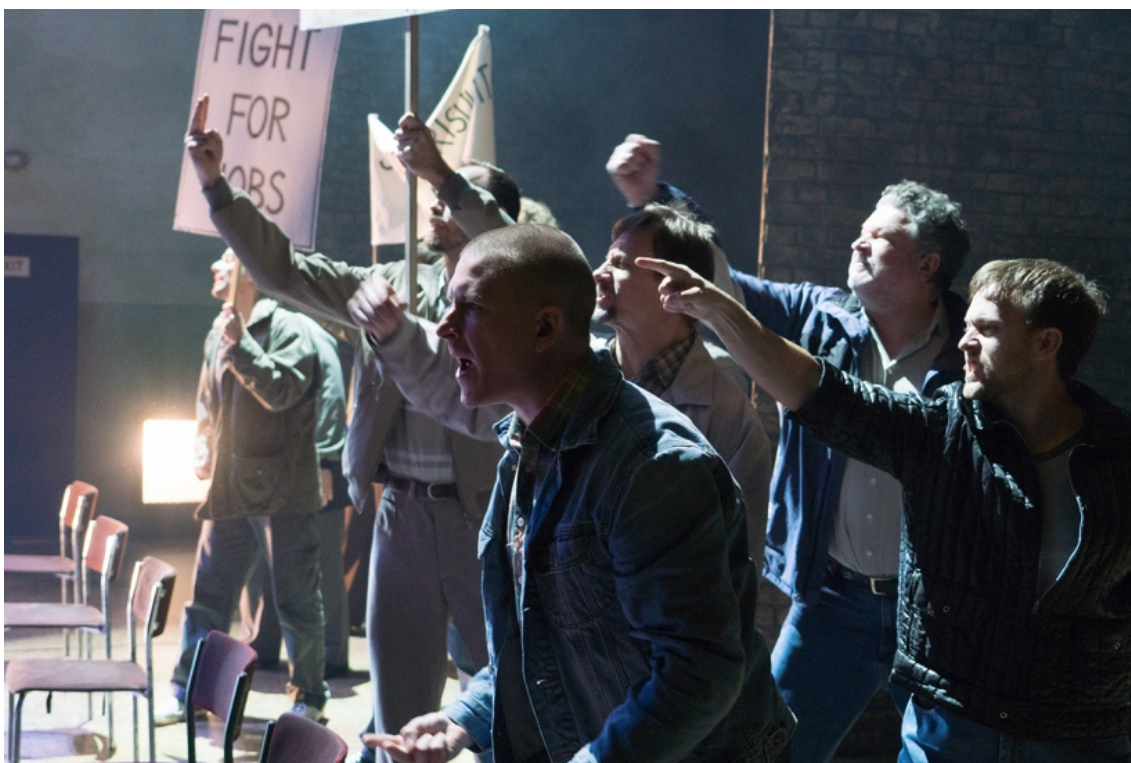
KUVA 6. Kaivostyöläiset mellakoimassa.

Myöskin videomateriaaleja läpi käydessäni tarkkailin Britannian lakkoilijoiden mellakkakylttejä ja niiden tekstejä ja valitsin niistä purevimmat iskulauseet, joita tarkkasilmäisimmät voivat nähdä TTT:n suurella näyttämöllä Solidaarisuus -numerona aikana.