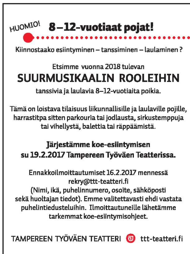
KUVA 2. Poikien hakuilmoitus.

Tampereen Työväen Teatteri laittoi suuren hakuilmoituksen Aamulehteen, jossa etsi pirkanmaalaisia poikia, jotka ovat sekä liikunnallisia että energisiä. Alkuvuodesta 2017 TTT:lle tuli noin 120 hakemusta, joista kaikki hakijat käytiin läpi yksitellen. Hakutilanteessa poikia tanssitetiin, leikitettiin ja laulatettiin ryhmissä ja yksin. Näin heitä karsittiin vähitellen niin paljon, että heitä jäi jäljelle enää 16. Nämä 16 poikaa aloittivat rankan Billy-koulun, joista lopulta vain 6 pääsi itse musikaaliin mukaan.