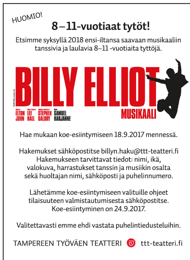
KUVA 3. Tyttöjen hakuilmoitus.