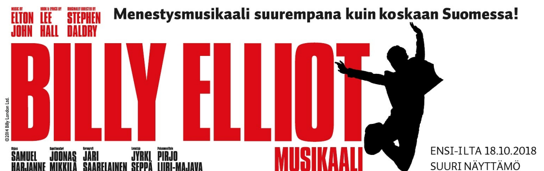
KUVA 1. Billy Elliot-logo ( http://www.ttt-teatteri.fi/ohjelmisto/billy-elliott )