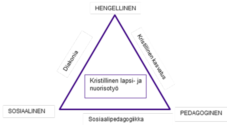
Kuvio 3. Kristillisen lapsi- ja nuorisotyön ulottuvuudet (Launonen, 2008, 233)

Kirkon nuorisotyö ei ole pelkästään kasvatuksellista, vaan kasvatus on osa sitä. Kirkon nuorisotyötä voidaan tarkastella hengellisen, pedagogisen ja sosiaalisen linssin läpi. Olemukseltaan työ on monialaista ja monimenetelmällistä ja se ilmenee monin eri tavoin. Kristillinen nuorisotyö voidaan nähdä kolmiona (kuvio 3), jonka keskellä nuorisotyö on jatkuvassa liikkeessä. Kärkinä ovat hengellinen, pedagoginen ja sosiaalinen. Nämä ulottuvuudet näkyvät kristillisessä kasvatuksessa läpi historian. Kirkon nuorisotyötä ohjaa kristillinen kasvatus, sosiaalipedagogiikka ja diakonia. Kolmiossa nämä ovat sivuina, rajapintoina. Kirkon nuorisotyössä siis painottuvat eri asiat riippuen toiminnosta. Toisinaan kirkon nuorisotyö on enemmän hengellistä ja toisinaan enemmän pedagogista tai sosiaalista. (Launonen 2008, 232-233.)