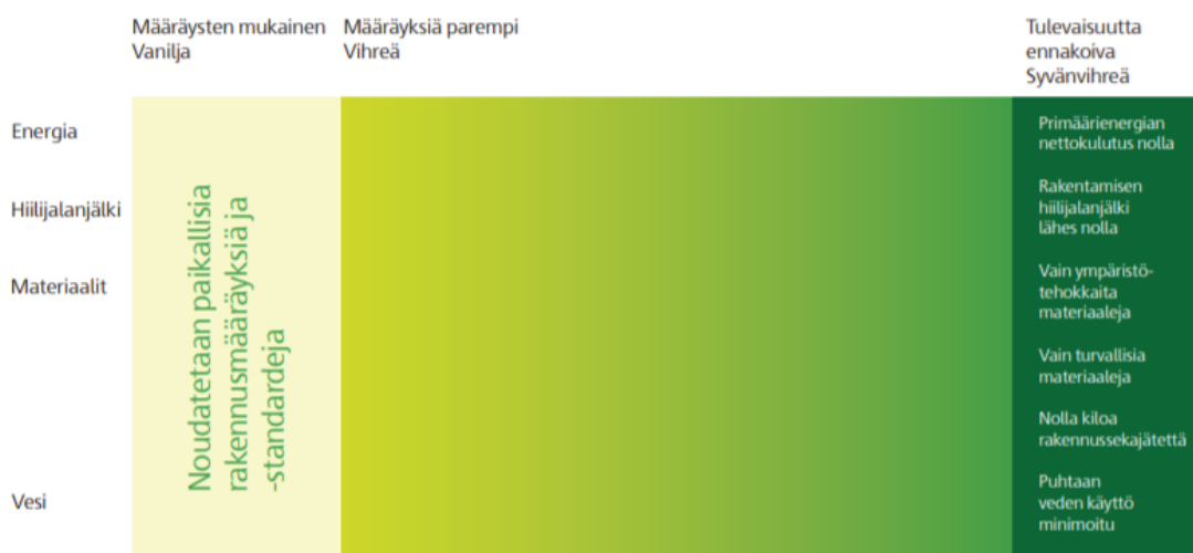
KUVIO 4. Skanska väripaletin tasot. Väripaletti 2017

Väripaletin arvionnissa otetaan huomioon neljä eri kategoriaa ks. kuvio 4, liite 2, joista pakollisina ovat energian ja hiilen osa-alueet. Tuotannon kannalta tärkeimmät osa-alueet vaikutusmahdollisuuksien kannalta ovat materiaalien ja jätteiden osa-alueet (Väripaletti 2017).