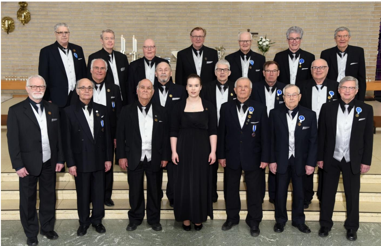
KUVA 2. Kokkolan Lauluveikkojen Seniorikuoro keväällä 2018

Kuoro on jaettu tavalliseen tapaan neljään stemmaan, ykkös- ja kakkostenoriin sekä ykkös- ja kakkosbassoon, ja niinpä sen ohjelmisto koostuu lähinnä perinteisistä neliäänisistä mieskuorolauluista. Kokkolan Lauluveikot, sekä Seniorikuoro kuuluvat molemmat Mieskuoroliittoon, joten iso osa Seniorikuoron ohjelmistosta tulee liiton perus- ja taitomerkkirjoista. Seniorikuoron ohjelmistoon otetaan harvoin ihan täysin uusia kappaleita, vaan kuoro laulaa vuosien varrella kertynyttä, laajaa ohjelmistoa lämmitellen aina silloin tällöin uudelleen vanhoja, jo unohtuneita suosikkeja. Daniel J. Levitinin (2010) mukaan ihmisen musiikkimaku on kehittynyt loppuunsa noin 20 vuoden iässä. Siksi onkin loogista, että seniorit laulavat mielellään lauluja, joita ovat laulaneet kuorotaipaleensa alkuaikoina.