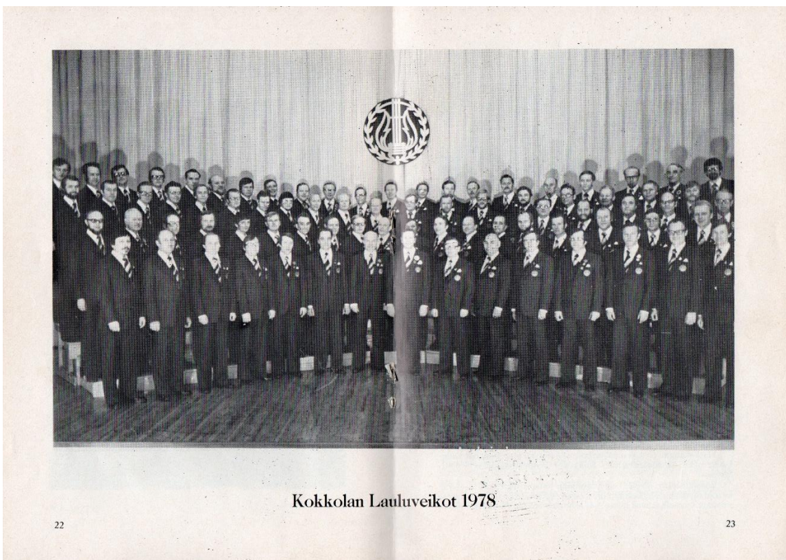
Kokkolan Lauluveikot 1978