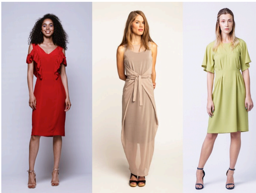
Kuva 3. Namedin kaavamalliston mekot Anni, Kielo ja Ansa (Named 2018).

Aluksi juhlapukujen teettämisestä keskustellessa puhuttiin noin 5–8:n mallin valitsemisesta Namedin mallistosta, mutta lopulta päädyttiin teettämään vain neljä pukua. Nämä valitut puvut olivat röyhelöhihainen Anni-mekko sekä pitkänä että lyhyenä ja Kielokietaisumekko hihattomana ja pitkähihaisena. Anni-mekon tärkein valintaperuste oli sen näyttävyys ja Kielo-mekko puolestaan on säädeltävä, joten se sopii todella monelle (kuva 3). Kuvassa 3 oikealla on myös Ansa-mekko, jota ei lopulta päätettykään teettää ainakaan tällä erää, koska Vaaterekkiin saatiin hankittua sen mallikappale suoraan Namedilta. Ansa-malli on kuitenkin hyvä esimerkki lainaamoon sopivasta juhlavaatteesta, koska se on sekä rento että melko näyttävä ja siinä on vain vähän kiinteitä mittapisteitä, joten se sopii monelle vartalotyypille.