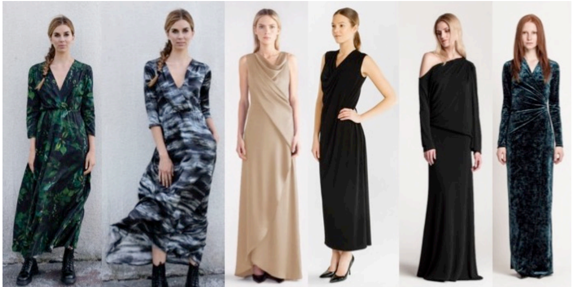
Kuva 2. Vaaterekin lainatuimmat iltapuvut (Vaaterekki 2018).

Vaaterekin yrittäjien mukaan avoimet pääntiet ja selät ovat hankalia lainaamovaatteissa, koska jäsenten tekee usein mieli laittaa niihin hakaneuloja, teippiä tai muita vastaavia viritelmiä. Lainaamon juhlapuvut ovat huomattavasti enemmän käytössä kuin yksityisten vaatekaappien puvut, joten neulat ja teipit voivat pidemmän päälle aiheuttaa esimerkiksi reikiä ja kulumia erityisesti herkistä materiaaleista valmistettuihin vaatteisiin. Kyselyssä yksi jäsen myös mainitsi toivovansa asuja, joiden kanssa voi käyttää normaaleja rintaliivejä. Vaikka avoimet pääntiet ja selät täyttävätkin näyttävyyden ja kiinnostavien leikkausten kriteerit, ne eivät siis kuitenkaan ole kovin optimaalisia lainaamovaatteissa.