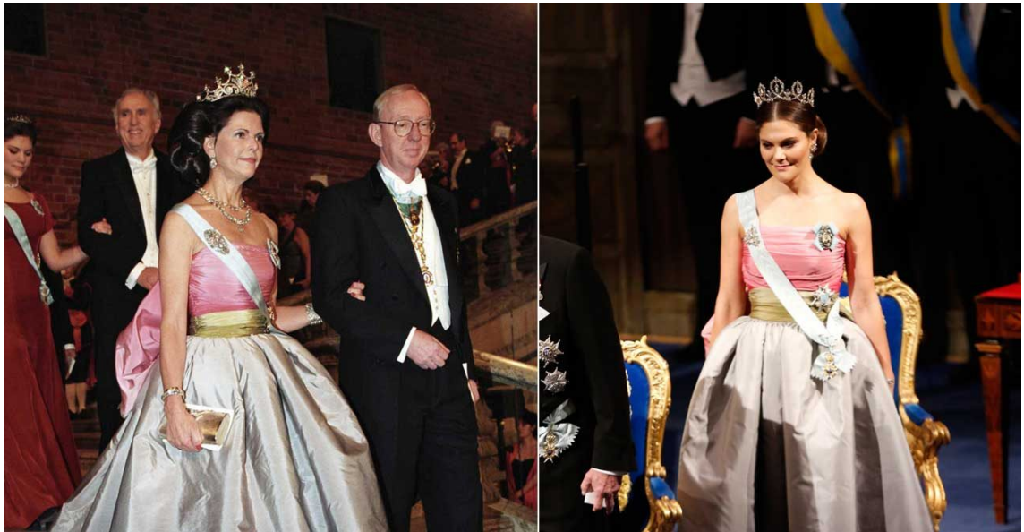
Kuva 1. Kuningatar Silvia ja prinsessa Viktoria Nobel-gaalassa 1995 ja 2018. (Svensk Dam 2018)

pukeutumalla Nobel-gaalaa äitinsä kuningatar Silvian vanhaan juhlapukuun (kuva 1) (Svensk Dam 2018).