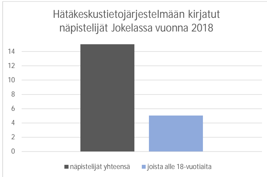
Kaavio 5. (Hätäkeskustietojärjestelmä, 2018)

jatkaa. Lisäksi haastateltavat kokivat, että poliisin kohtaaminen neutraalissa tilanteessa, jossa nuori ei ole rikosepäilyn kohteena, olisi nuoren asennoitumisen kannalta tärkeää. Nuoren asennoituminen lakeihin, sääntöihin ja normeihin on toki monen asian summa, mutta läsnä olemalla poliisi voisi ohjata sitä osaltaan oikeaan suuntaan.