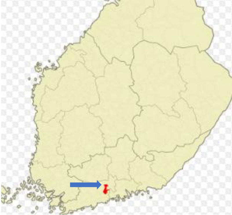
Kartta 1: Tutkimukseen valitun alueen sijainti Suomessa. Tuusulan kunta merkitty karttaan punaisella. Sininen nuoli osoittaa Kartan 2 esittämää aluetta.