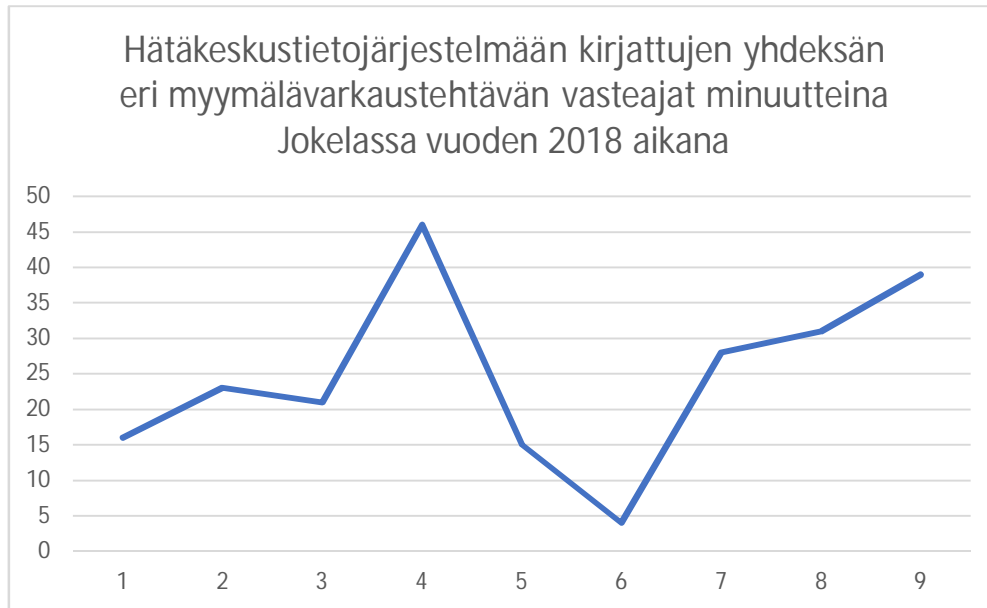
Kaavio 3. (Hätäkeskustietojärjestelmä, 2018)

Kaaviossa 3 on esitetty myymälävarkautehtävien vasteaikoja minuutteina. Kaavio kuvaa vasteaikojen vaihteluväliä ja sitä, ettei poliisin paikalle saapuminen vie aina yhtä kauan. Joskus poliisi on tullut paikalle jopa alle viidessä minuutissa, kun taas toisinaan paikalle saapuminen on vienyt yli 45 minuuttia. Tätäkään kaaviota ei voida pitää täysin validina, sillä se perustuu ainoastaan yhdeksään hätäkeskustietojärjestelmään kirjattuun myymälävarkautehtävään.