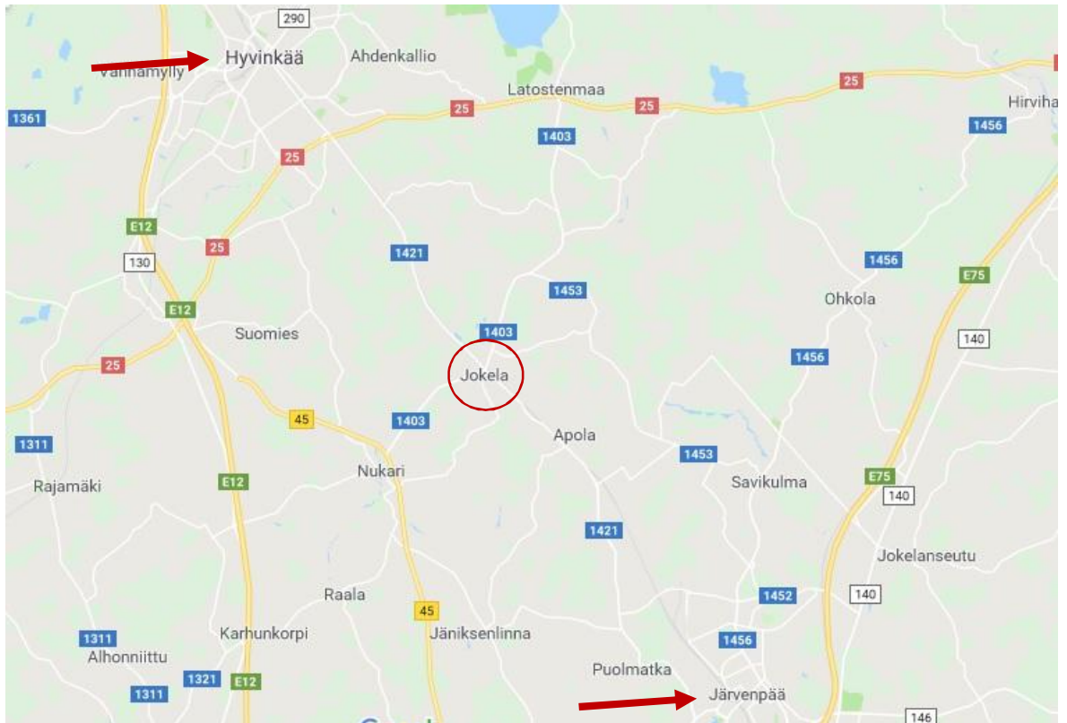
Kartta 2: Jokelan sijainti ympyröity. Kaikki tutkimuksessa mukana olleet yritykset sijaitsevat ympyrän sisäpuolella. Etäisyys sieltä Hyvinkäälle ja Järvenpäähen on suunnilleen yhtä pitkä, noin 10 kilometriä. Hyvinkää ja Järvenpää merkitty nuolella.