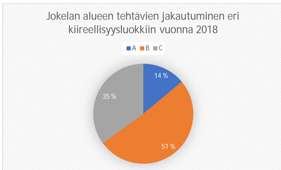
Kaavio 4. (Hätäkeskustietojärjestelmä, 2018)

Lisäksi vasteaikoihin vaikuttaa luonnollisesti tehtävän kiireellisyysluokka. Kuten muissakin paikoissa, myös Jokelassa suurin osa näpistystehtävistä on kiireellisyydeltään B-luokkaa. Kuitenkin näpistystehtävien joukkoon mahtuu myös tilanteita, joissa tehtävä määritellään A- tai C-luokan tehtäväksi. A-luokan tehtävien ovat kiireellisimpiä, ja C-luokan tehtävät kiireettömmimpiä poliisin tehtäviä.