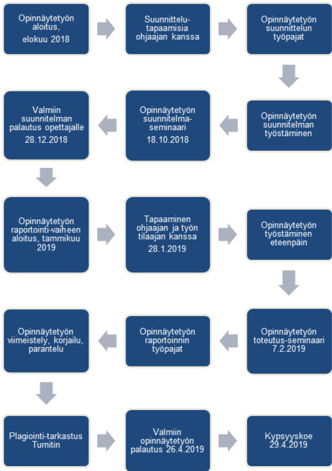
Kuvio 2. Opinnäytetyön eteneminen