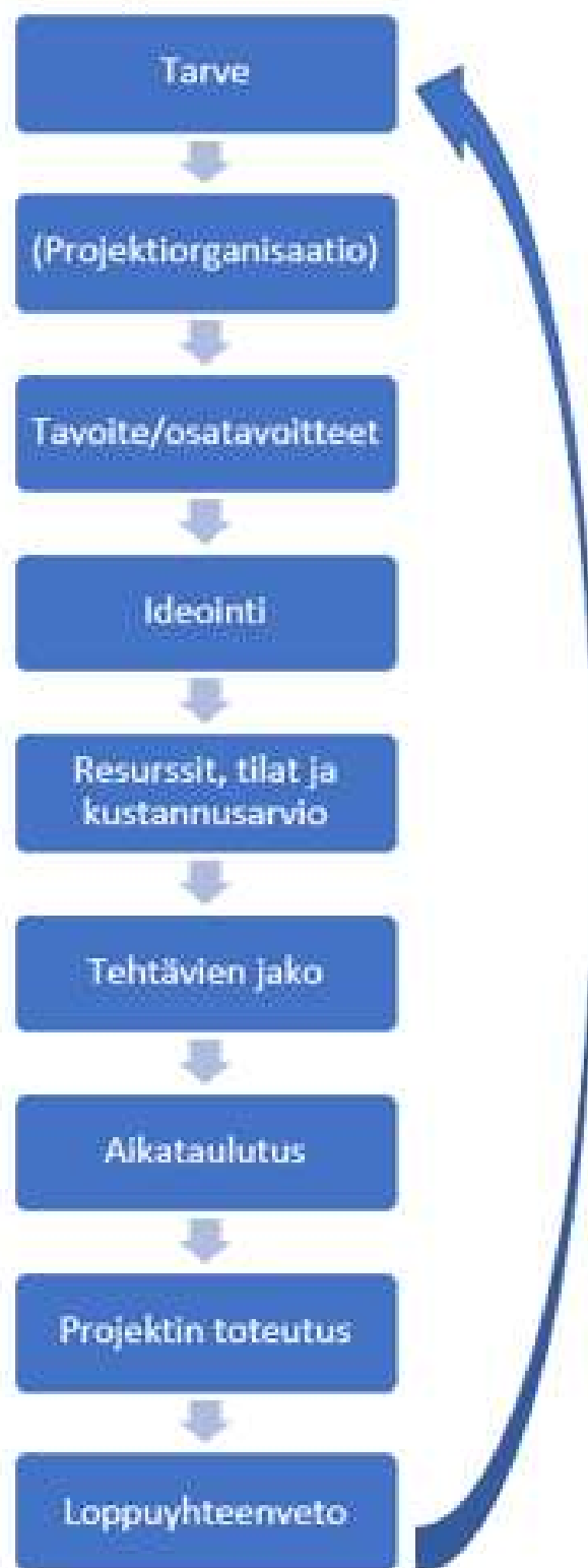
Kuvio 1. Projektin vaiheet.