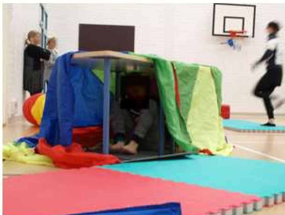
KUVA 1: Tunneli.