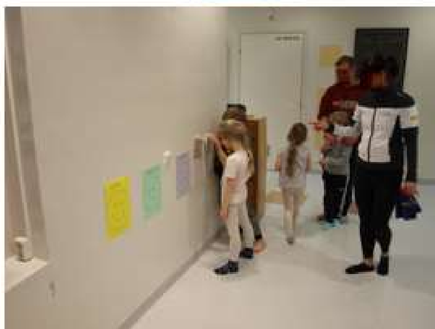
KUVA 9. Lasten palautetaulut.

Käydään lasten kanssa läpi koko projekti. Keskustellaan, mikä oli kivaa ja mitä opittiin.