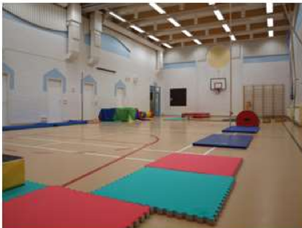
KUVA 3. Tyhjä parkour-rata.

Järjestetään liikuntailta kaikkien esioppilaiden perheille.