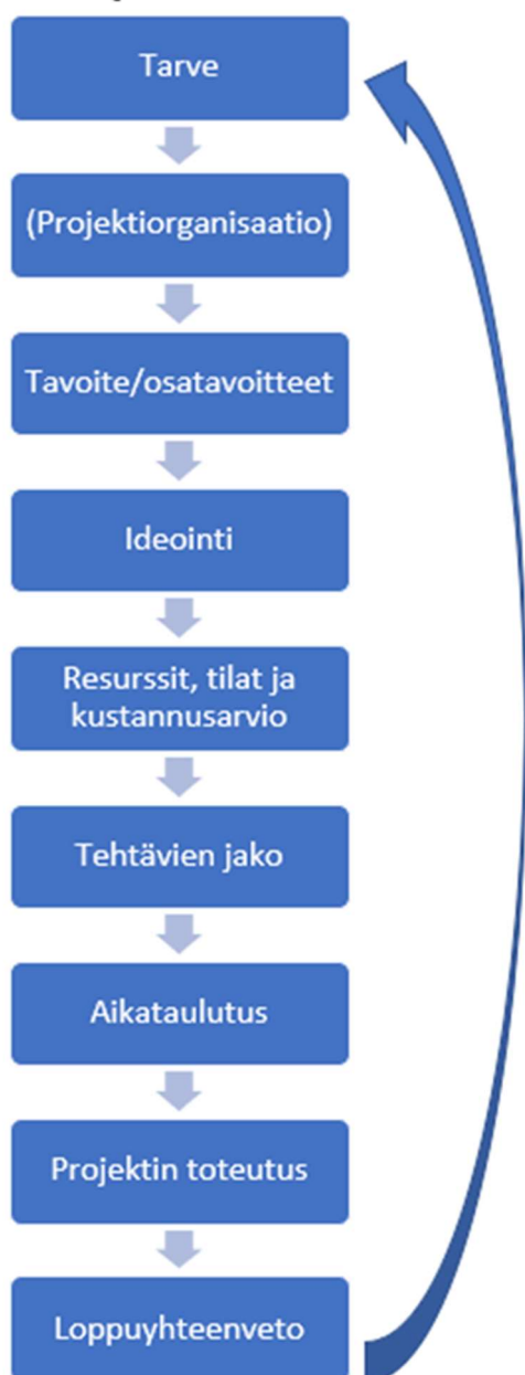
KUVIO 3. Projektin suunnittelun vaiheet projektimallissa