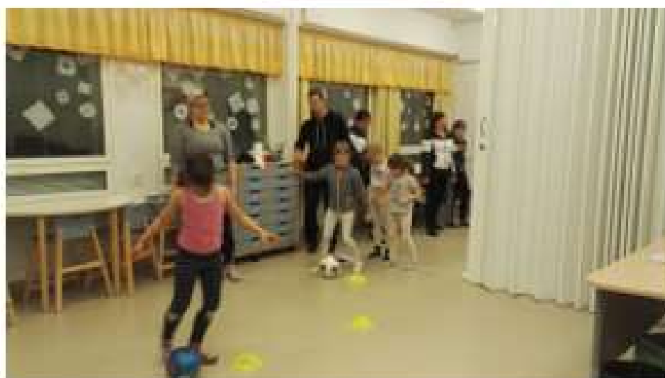
KUVA 4. Pujottelu