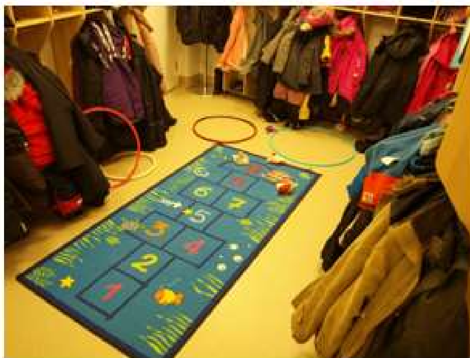
KUVA 8. Tarkkuusheitto.

Perheet saapuvat ja heidät jaetaan ryhmiin. Perheet alkavat kiertää pisteitä. Otetaan valokuvia.