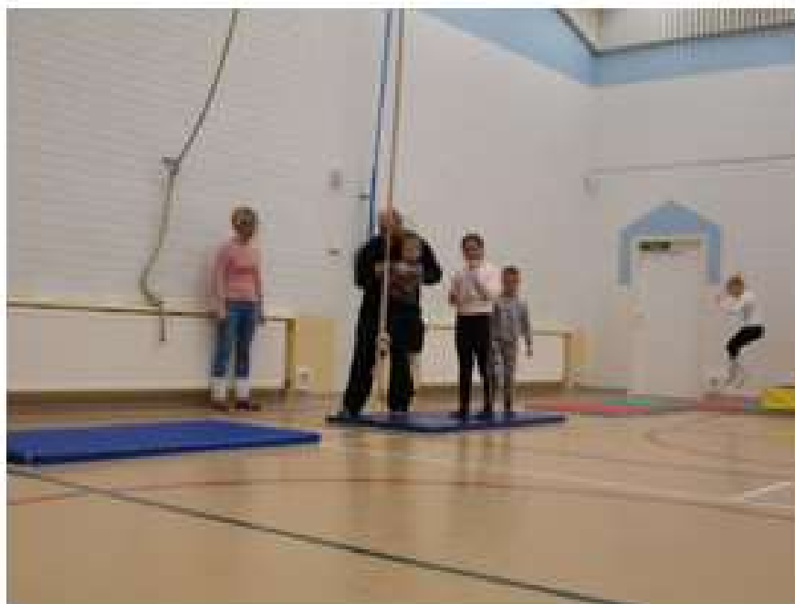
KUVA 7. Pikkulapsi liianissa.