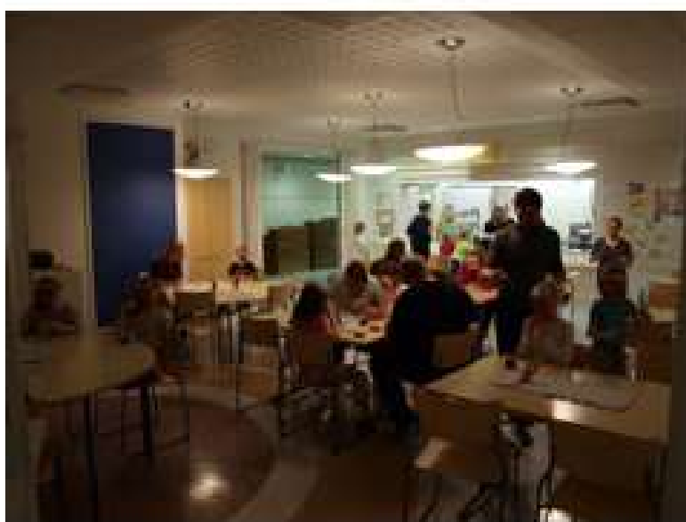
KUVA 6. Iltapala.

Sovitaan aikuisten ja lasten tehtävät Perheillassa. Yksi aikuisista on järjestänyt paljon lasten liikuntaryhmiä. Kysytään hänen mielipiteitään toteutukseen.