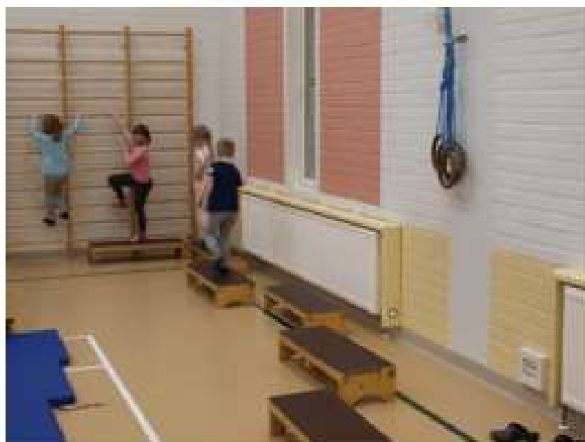
KUVA 5. Kivet purassa.

Sovitaan, kuka tilaa ruokatarvikkeet. Suunnitellaan tilojen käyttö. Rahaa kuluu vain tarjoiluihin. Ne maksaa päiväkot.