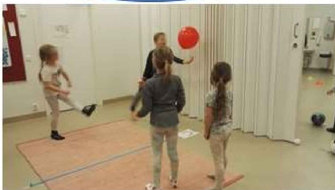
KUVA 2. Ilmapallolentopallo.

Lapset kertovat pitävänsä hyppimisestä ja ilmapalloista.