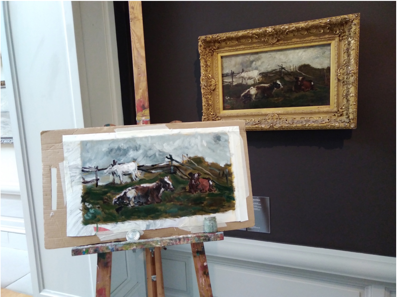
Kuva 6. Tiina Majabacka: Taulujen toisintamista Museum of Fine Arts Ghentissä, 2018.