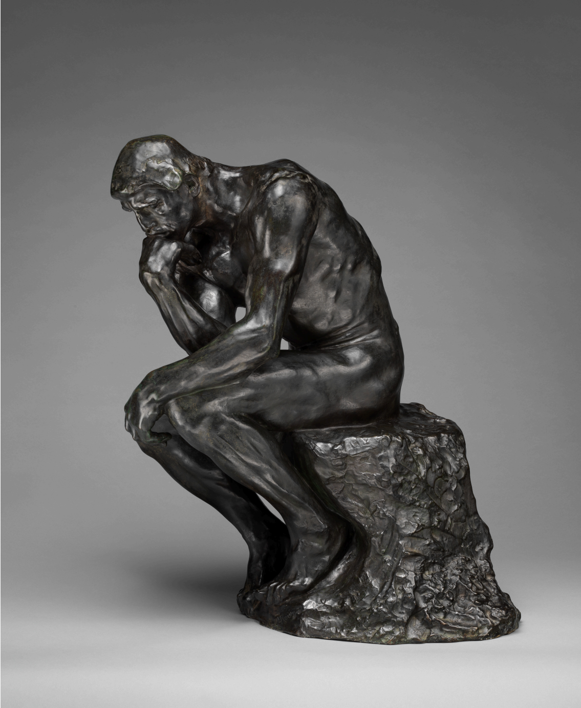
Kuva 2. Auguste Rodin: Ajattelijä, n. 1880 (n. 1910 valos).