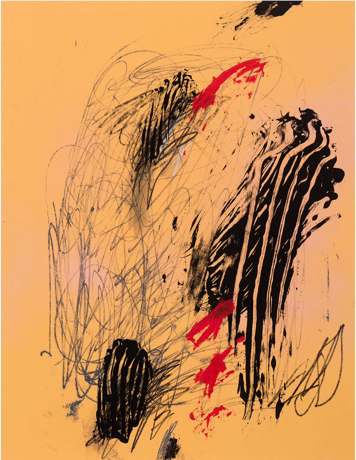
Kuva 10. Olli Piippo: (Untitled) Sketches for Oceanic Feeling, 2018.