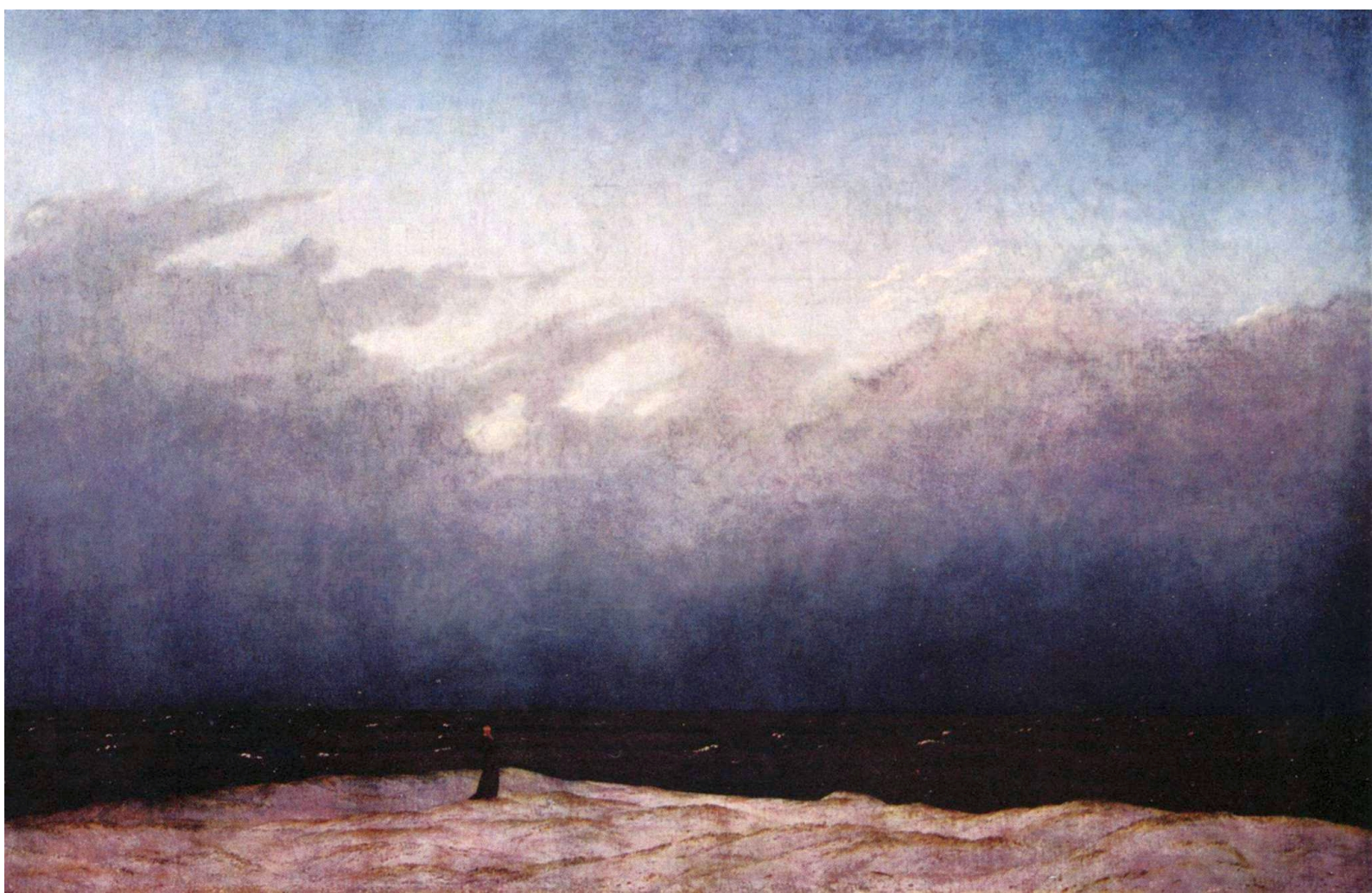
Kuva 4. Caspar David Friedrich: Der Mönch am Meer (Munkki meren rannalla), 1809.