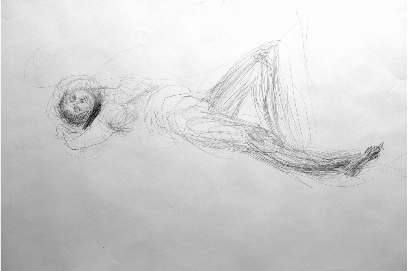
Kuva 1. Tiina Majabacka: Alastonmallipiirustus, 2018.