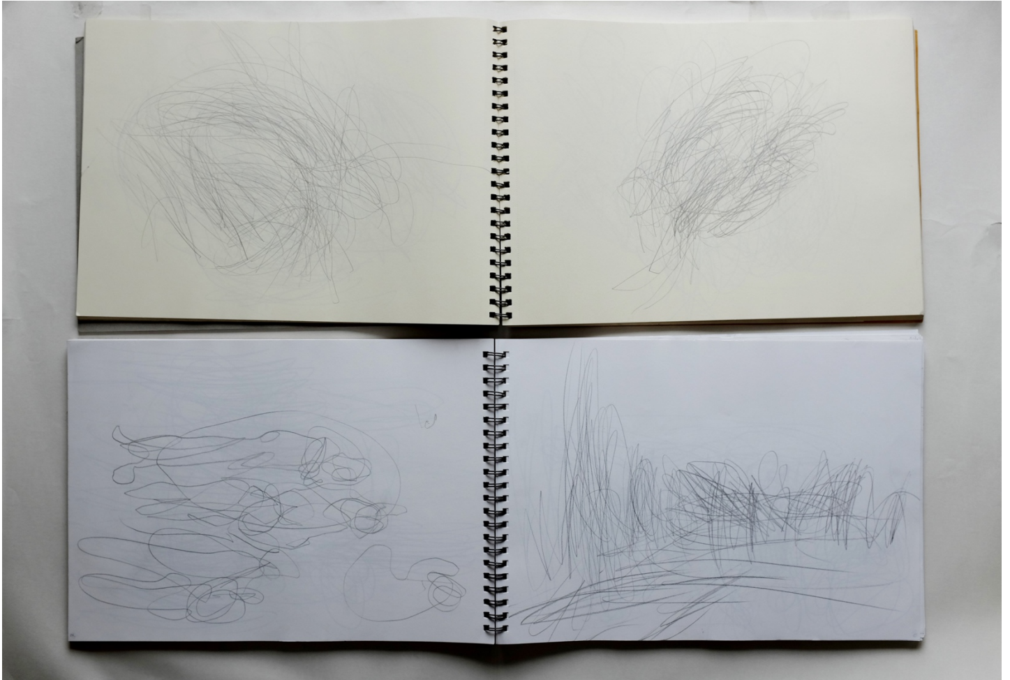
Kuva 3. Tiina Majabacka: Elepiirustuksia Ghentissä, 2018.