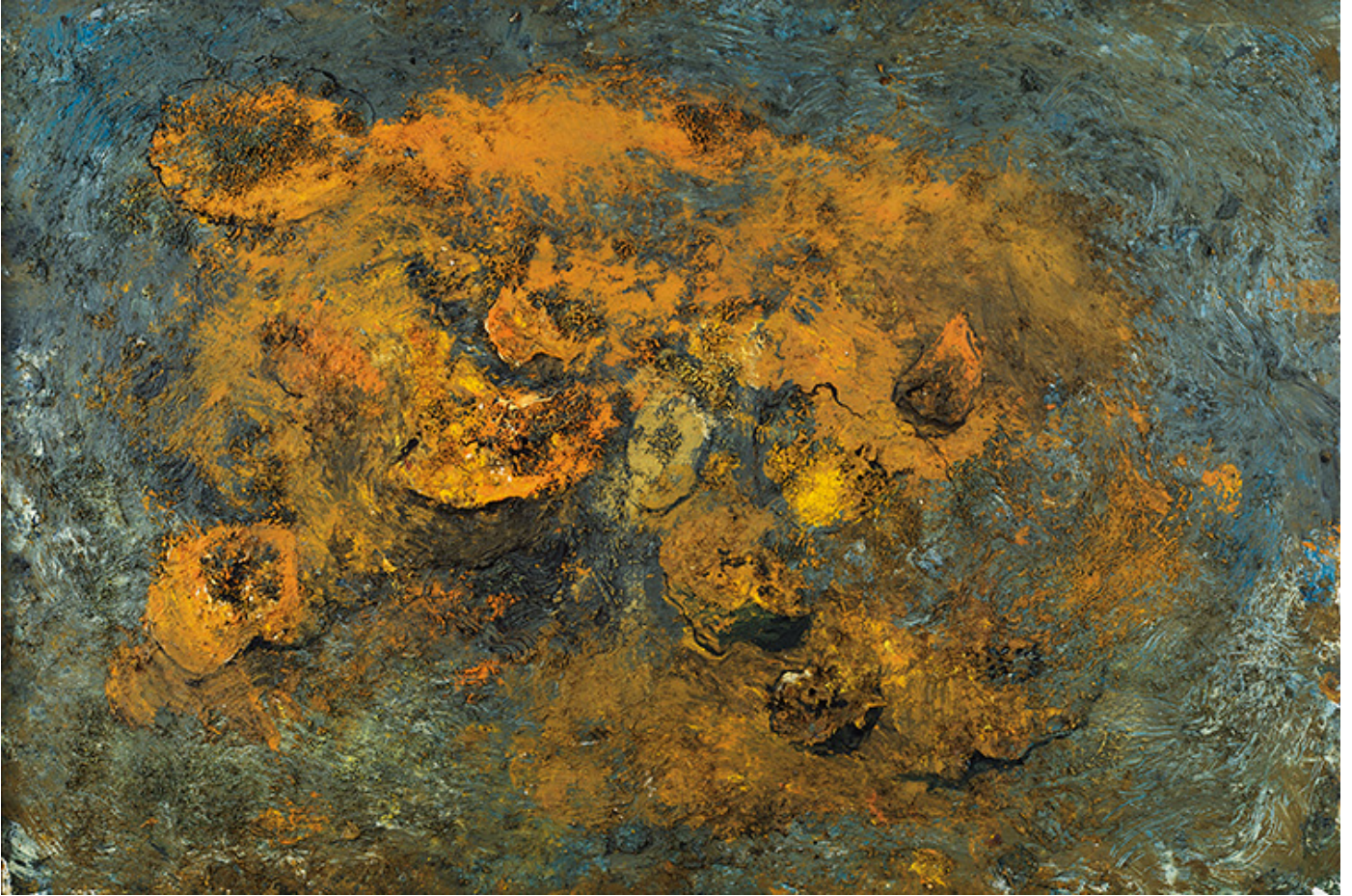
Kuva 8. Miquel Barcelo: Des potirons, 1998.