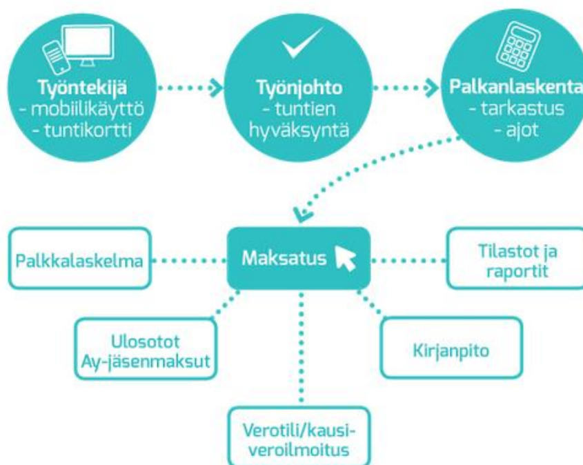
KUVIO 1. Palkkahallinnon toiminnan kuvaus. (admicom 2/2019)

Adminetin palkkahallinto on myös pitkälle automatisoitu, joka vähentää käsin tehtävän työn määrää. Automatiikan johdosta palkkahallinnon pitäisi helpottua ja keskittyä palkkojen tarkastamiseen ja hyväksymiseen. Adminetin palkkahallinnon automatiikka hoitaa esim. palkkojen maksatuksen, palkkalaskelmat, sotujen ja ennakonpidätyksen maksut, lomapalkkakertymät, työajanlyhennykset, verokorttien haut, kirjaukset kirjanpitoon ja työehtosopimusten mukaiset palkkojen korotukset. (kuvio 1.)