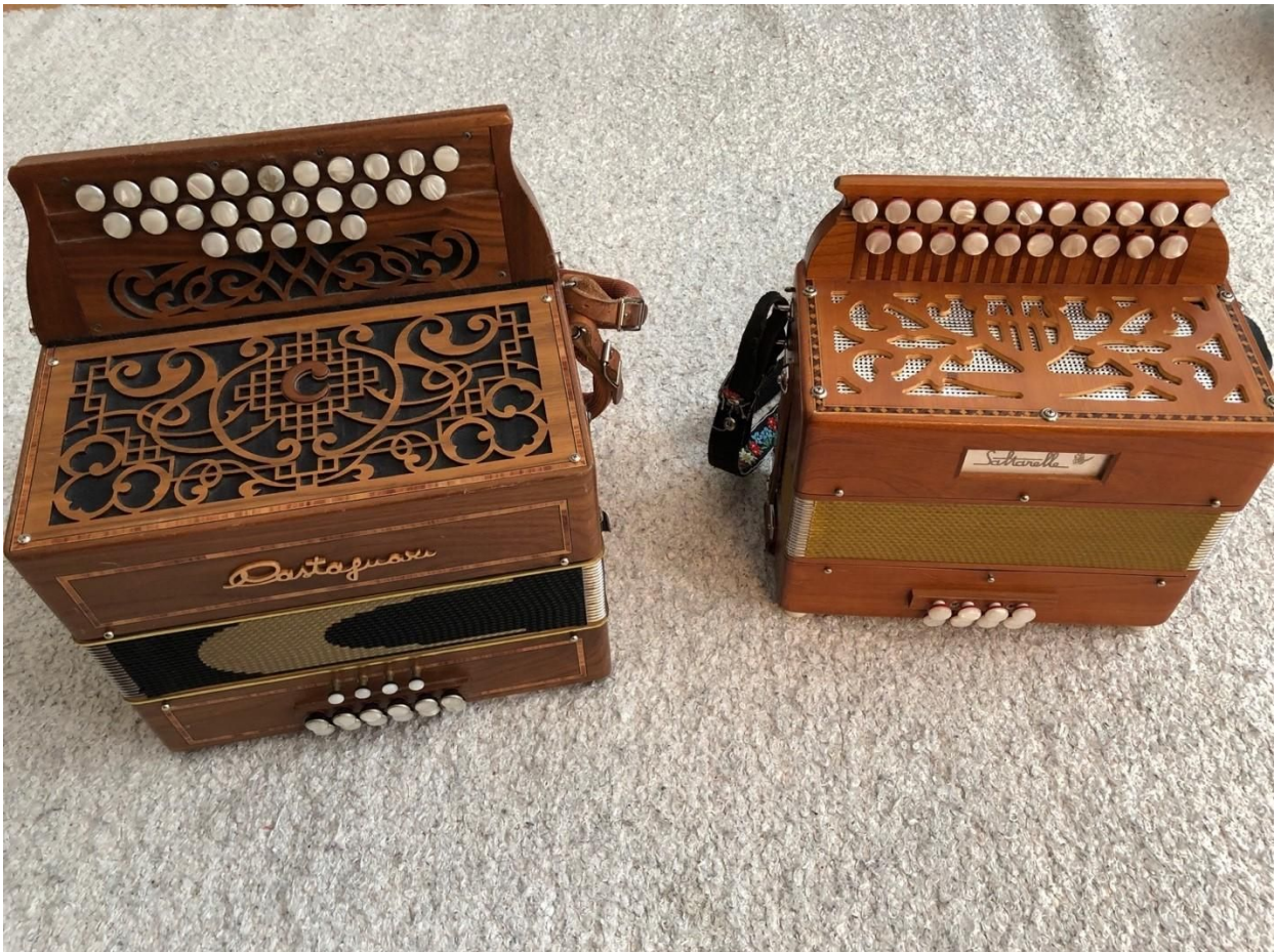
KUVA 1. 2 ½ - ja 2-riviset haitarit