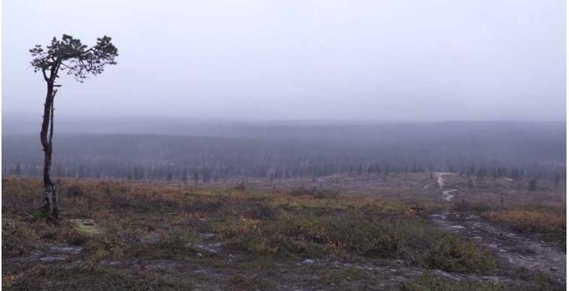
Kuva 2. Kuvakaappaus Sanoja ja tekoja -produktiosta.

Äänisuunnittelussa jouduin itselleni vieraalle maalle. En ole leikannut koskaan fiktiivistä elokuvaa, enkä journalistisia videoita tehdessänikään ole joutunut käsittelemään ääntä paljoa, saati sitten rakentamaan kokonaista äänimaisemaa. Äänen tallentaminen ja kuuleminen pelkkänä äänenä ja kuvan näkeminen pelkkänä kuvana oli virkistävää. Esimerkiksi, kun harhailin kovalla pakkasella liikennevaloissa äänitallentimen kanssa odottaen juuri oikeanlaista useiden eri liikennevalojen luomaa rytmiä ja etsien oikeaa etäisyyttä eri äänilähteiden välillä, huomasin kuuntelevani niin tarkasti ja havainnoiden, että tuskin olin koskaan videota kuvatessani ollut yhtä hereillä äänen suhteen.