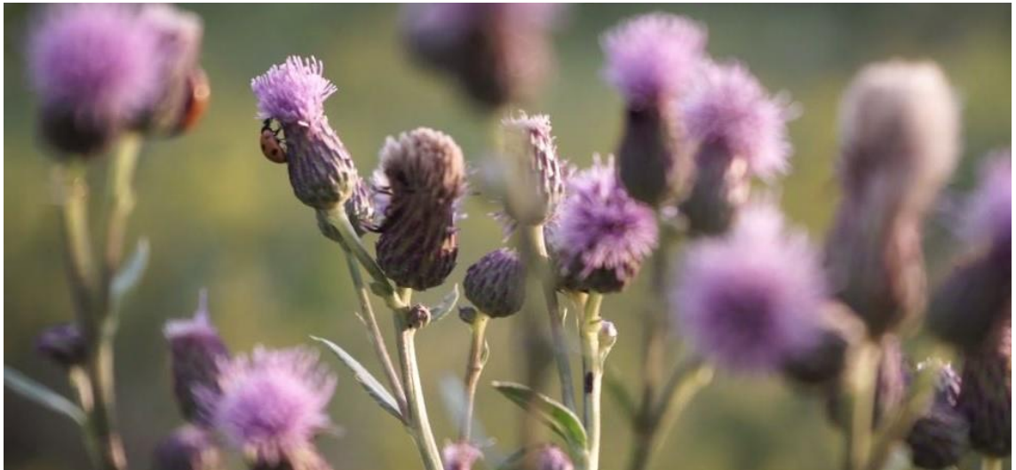
Kuva 5. Sanoja ja tekoja-elokuvan kohtauksessa nähdään kukassa kiipeävä leppäkerttu, mutta kuullaan koneen ruksutusta.

Kohtauksia voidaan rakentaa niin, että katsoja-kuulija luo itse diegeettiä assosioimalla. Hyödynnän tätäkin keinoa, jotta kuvalle ja äänelle syntyisi enemmän yhteyttä. Esimerkiksi kohtauksessa, jossa nähdään rauhallinen järvimaisema ja kuullaan liikennevalojen piippausta, liikennevalojen äänestä voi syntyä katsojalle assosiaatio kuikan ääntelystä, koska yhdistämme kuikan laulun helposti järvimaisemaan. Samoin kohtauksessa, jossa leppäkerttu kiipeää niittyohdakkeen vartta pitkin, konemaisen ruksutuksen voi assosoida kuuluvaksi leppäkertusta, ikään kuin leppäkerttu olisi kone. Erääseen kohtaukseen, jossa kuvataan järven pintaa sateella, rakensimme ropisevan, mutta metallimaisesti kai-kuvan, teolliselta kuulostavan äänen.