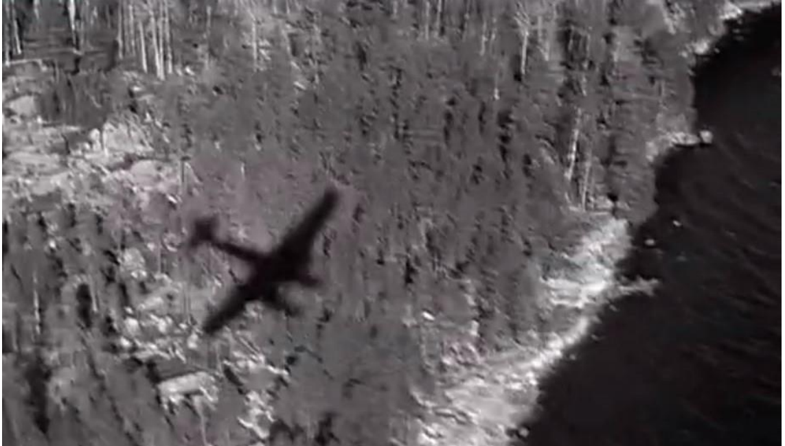
Kuva 3. Kuva lentokonekohtauksesta elokuvasta Vesikaupunkeja.