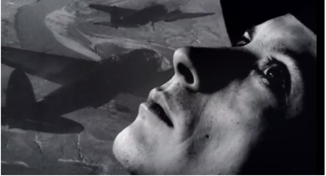
Kuva 4. Vesikaupunkeja-elokuvan kohtaus, jossa on asynkronista ääntä.