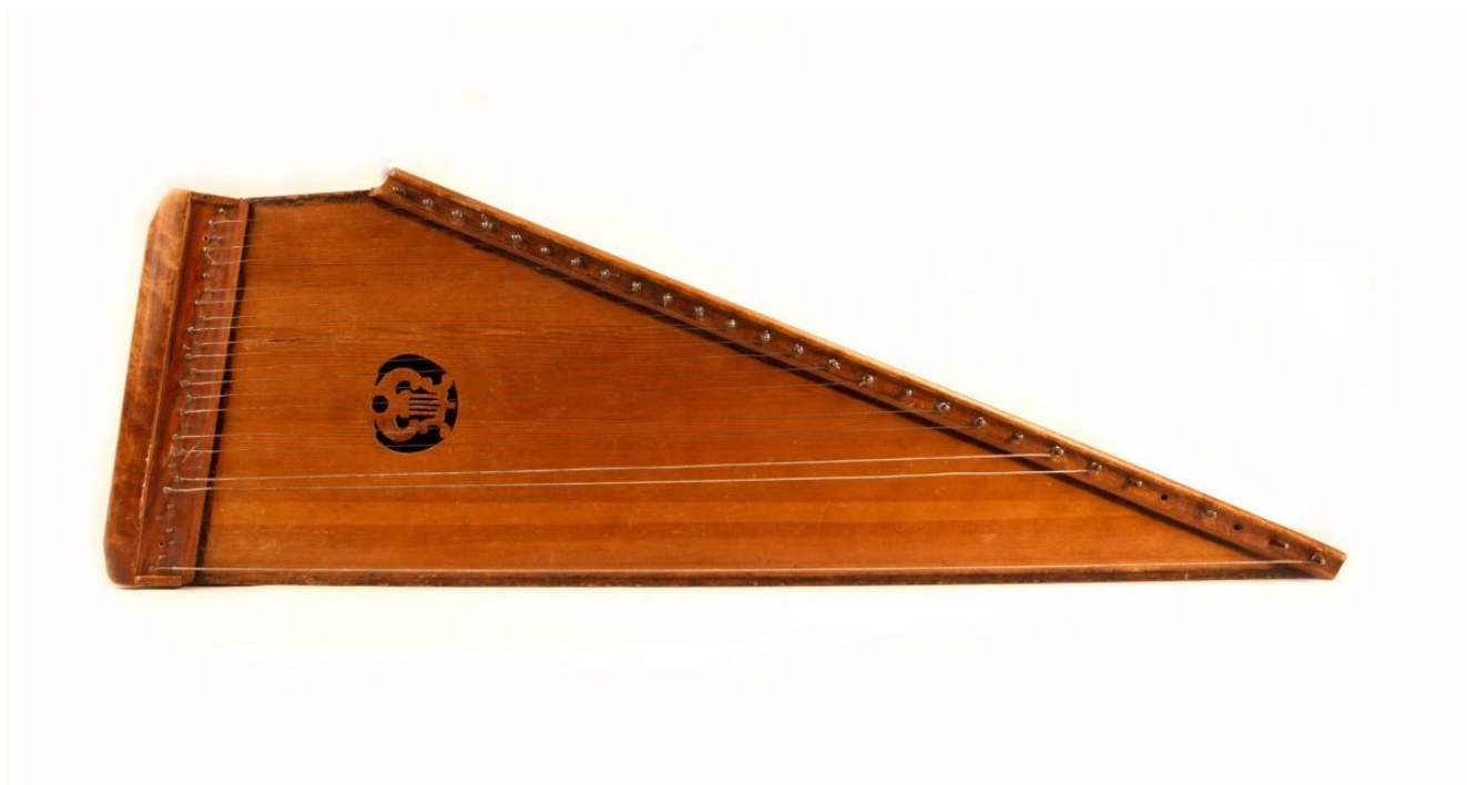
KUVA 1. Tammisen rakentama 28-kielinen Saarijärven kantele (Dahlblom 2011, 111)

Saarijärven kantele on yksi kantelemalli, joka kuuluu valtavaan kanteleperheeseen. Tätä kyseistä kanteletta soitetaan sulkutyylillä, jossa vasemman käden sormet sammuttavat eli ”sulkevat” osan kanteleen kielistä. Avoimeksi jääviä kieliä soitetaan esimerkiksi puutikulla tai nahanpalalla krapsien. Saarijärven kantele on G-vireinen eli se on viritetty G-duuriin. Tämä viritys on mahdollistanut yhteissoiton muiden samanvireisten soitinten kanssa, kuten kaksirivisen haitarin, vuosikausien ajan. Saarijärven kantele ei nykyään sijoitu maantieteellisesti vain Saarijärven alueelle, vaikka soittimen nimestä voisi toisin luulla. Aiemmin kyseisiä kanteleita on soitettu pääasiassa vain Keski-Suomen alueella, Saarijärven seudulla, mutta nykyään Saarijärven kanteleen taitajia löytyy ympäri Suomea (KUVA 1). (Ala-Könni 1963; Dahlblom 2011; Nieminen 2018.) Tässä pääluvussa käsittelen lyhyesti kanteleen historiaa, mutta keskityn tuomaan esille tutkimusaiheeni Saarijärven kanteleen historiallista taustaa ja soittotekniikoita.