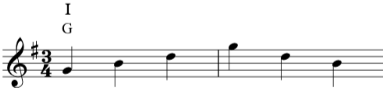
NUOTTIESIMERKKI 5. Kolmisointukuljetukset Vanhassa valssissa