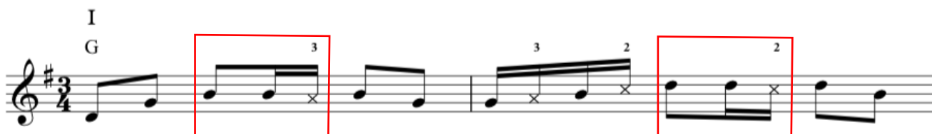
NUOTTIESIMERKKI 4. Perinteinen Polska ja tan-ta-ka -rytmi

Polska oli Hienohelman tapaan ensimmäisiä kappaleita, joita opettelin soittamaan Saarijärven kanteleella. Kyseinen kappale on todella mukaansatempaava melodiakoukeroidensa ansiosta. Lisäksi melodia on enemmän laulunomainen, joka luo vaihtelevuutta polkkiin verrattuna (NUOTTIESIMERKKI 4).