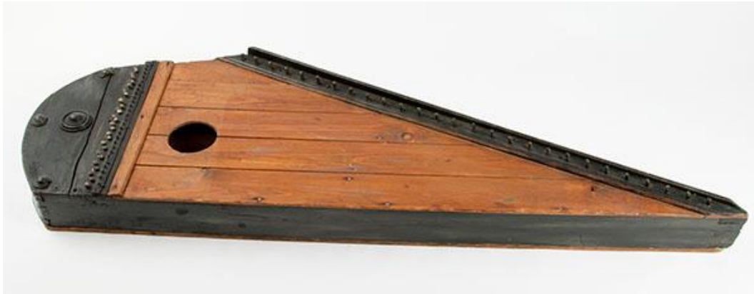
KUVA 3. Pyöreäperäinen laatikkokantele

alettiin soittaa eroasentoisesti, jossa toisella kädellä soitetaan melodiaa ja toisella melodiaa säestetään soinnuilla. Elias Lönnrot on yksi laatikkokanteleen tunnetuimpia ja ensimmäisiä kehittäjiä. (Saha 2006, 407; etno.net; Laitinen 2010, 134-139; Laitinen 2019.)