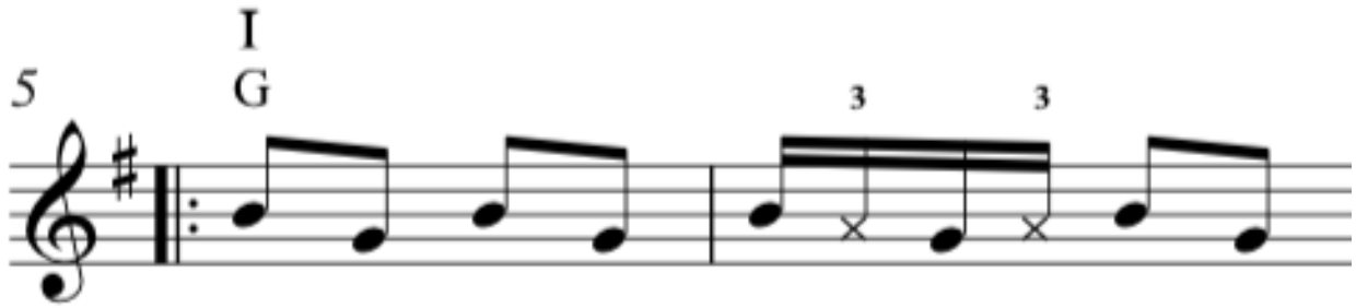
NUOTTIESIMERKKI 3. Kaksi tahtia kappaleen Kahvipannu b-osasta