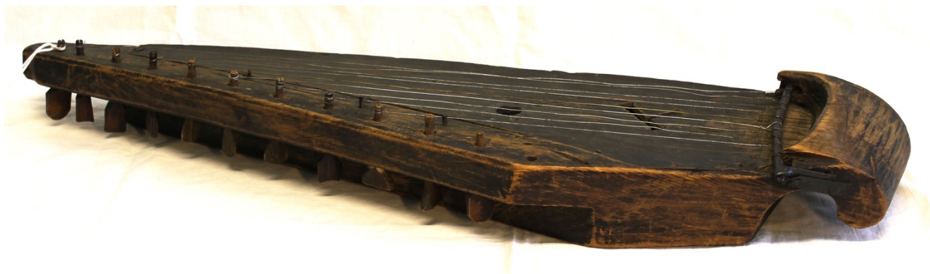
KUVA 2. Hämeenlinnan historiallisen museon 12-kielinen koverrettu kantele (Temps.fi)

Nykyään melkein kaikissa kanteleissa käytetään pääasiassa metallitappeja, sillä ne pitävät soittimen paremmin vireessä. Aiemmin kanteleen kielet oli tehty jousista tai jänteistä, mutta myöhemmin niitä alettiin tehdä teräksestä sekä vaskesta. Koverrettua kanteletta soitettiin yhdysasentoisesti, jolloin oikean ja vasemman käden sormet ovat lomittain toisiinsa nähden. Jokaisella sormella on oma kieli, jota näpätään. (Saha 2006, 404–407; etno.net; Laitinen 2010, 121-130; Laitinen 2019.)