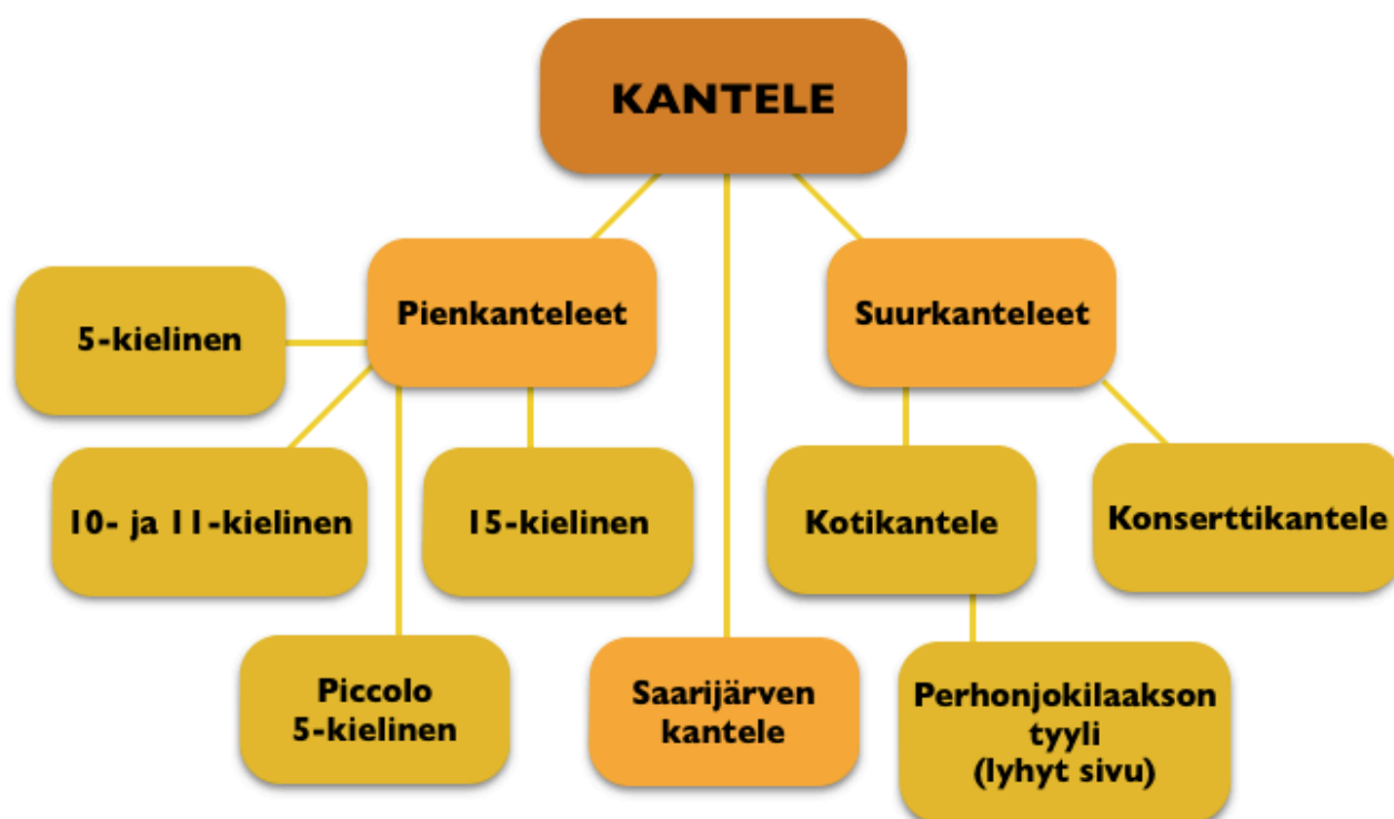
KUVIO 1. Suomalainen kanteleperhe

Kantele on Suomen kansallissoitin, jonka historia ulottuu yli tuhannen vuoden taakse. On arvioitu, että kantele olisi 2000-3000 vuotta vanha soitin. Varhaisimpiin 5-kielisiin museokanteleisiin on kaiverrettu vuosiluvut. Vuonna 1699 löydetty 5-kielinen kantele on vanhin kantele. Kahdentuhannen vuoden aikana kanteleen kehitys on ollut hyvin suurta. Kanteleen alkuperä ei ulotu vain Suomeen. Se on kehittynyt samaan aikaan laajasti Itämeren itä- ja pohjoispuolella, joissa soitin on nykyään kanteleen muotoinen. Näin ollen kanteleella on monia sukulaissoittimia, esimerkiksi Latviassa kokle, Virossa kannel ja Venäjällä gusli. Suomalaiseen laajaan kanteleperheeseen kuuluvat pienkanteleet (5-kielisestä kanteleesta 15-kieliseen), suurkanteleet (koti- ja konserttikantele), sekä Saarijärven kantele, jota käsittelen tässä opinnäytetyössä (KUVIO 1). (Saha 2006, 399–403; etno.net; Laitinen 2010, 11-18).