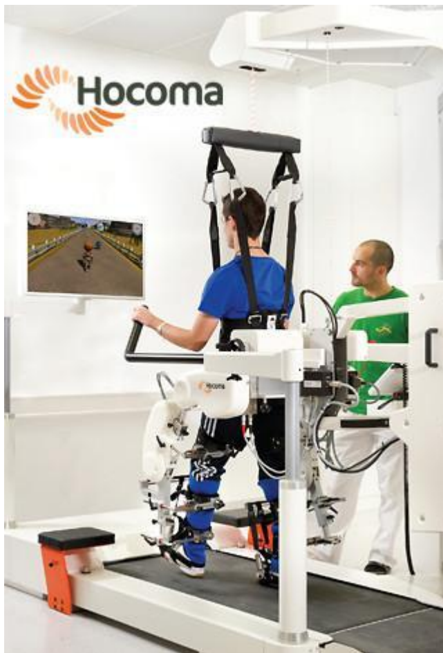
Kuva 1 Lokomat-kävelyrobotti

saadaan säädettyä vaikeutta ja tasoa huomioiden potilaiden kognitiivisen tason sekä erityistarpeet. (Calabro ym. 2015.)