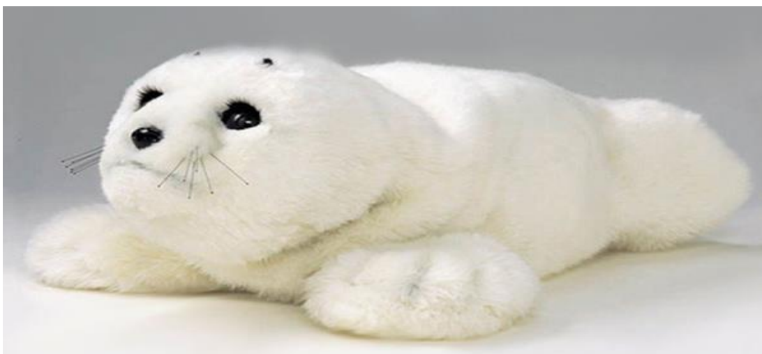
Kuva 2: Paro-seurarobotti (Innohoivan www-sivut .)

Dementiaa sairastavilla saattaa olla käytöshäiriöitä, jotka lisäävät hoidon kustannuksia. Usean vuoden ajan on tiedetty lemmikkihoidon olevan hyödyllistä niiden ehkäisyssä. Robotin käytöllä lemmikkinä on osoitettu olevan samanlaisia positiivisia vaikutuksia ilman perinteisten lemmikkieläinten negatiivisia puolia. Sen on katsottu laskevan sykettä ja vähentävän kipu- ja psykoaktiivisten lääkkeiden käyttöä iäkkäillä dementiaa sairastavilla potilailla. (Petersen ym. 2017.) Dementiaa sairastavat nauttivat kanssakäymisestä Paron kanssa ja jakavat tälle asioitaan (Robinson ym. 2016, 106).